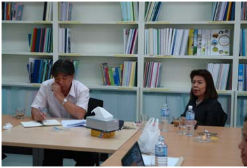
บรรยายภายในห้องประชุม