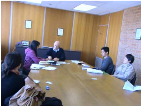
บรรยายการในห้องประชุม