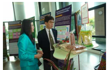
บรรยากาศภายในงานนิทรรศการวันสหกรณ์แห่งชาติ ประจำปี 2553