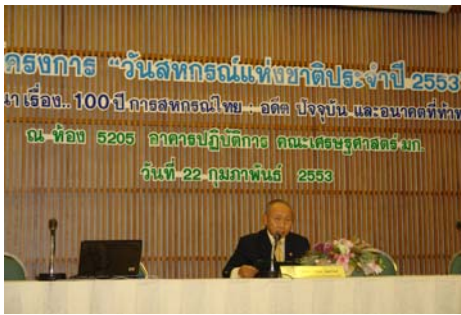
บรรยากาศในห้องประชุม

วันที่ 22 ถึง 26 กุมภาพันธ์ พ.ศ. 2553 ณ ห้อง 5205 อาคารปฏิบัติการ คณะเศรษฐศาสตร์ มหาวิทยาลัยเกษตรศาสตร์