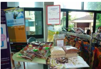
ออกร้านจำหน่ายสินค้ากลุ่มเกษตรกร สินค้าสหกรณ์