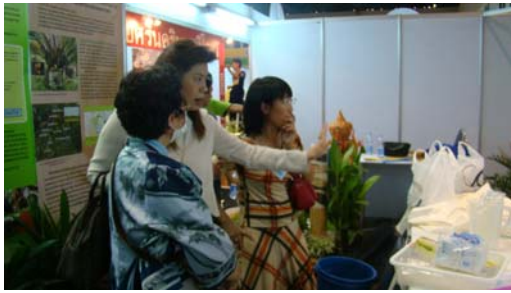
ผู้สนใจเยี่ยมชมบู๊ทต่างๆ