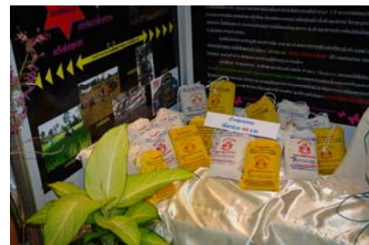
บรรยากาศภายในงาน มีผู้สนใจเยี่ยมชมบู๊ทและสินค้าต่างๆ