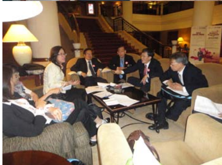
บรรยากาศในห้องประชุม

วัตถุประสงค์การเดินทางในครั้งนี้ก็เพื่อแลกเปลี่ยนเรียนรู้ประสบการณ์กับเครือข่ายสหกรณ์ที่เข้าร่วมประชุม และเพื่อศึกษาหาประสบการณ์มาเป็นแนวทางการจัดการประชุมสัมมนานานาชาติ International conference ที่ภาควิชาสหกรณ์ คณะเศรษฐศาสตร์ มหาวิทยาลัยเกษตรศาสตร์จะจัดขึ้นในราวเดือนพฤศจิกายน 2555