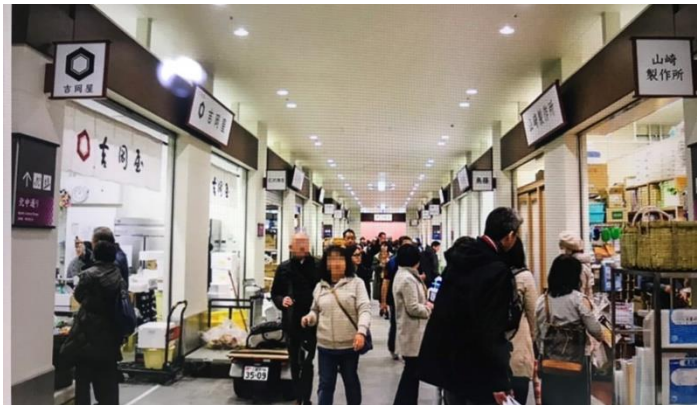
ชั้นสี่เรียกว่า Uogashi Yokocho มีร้านขายของ 69 ร้าน