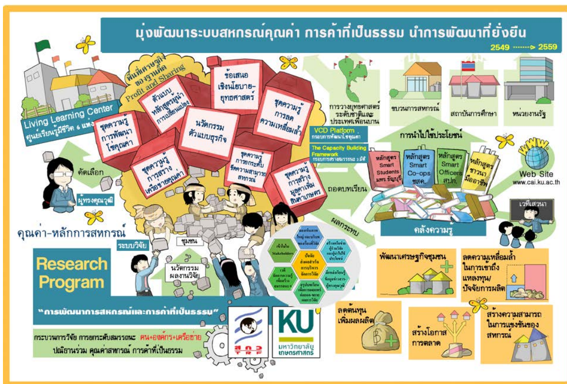
รูปที่ 4 ระบบการวิจัยชุดโครงการวิจัย “การขับเคลื่อนการพัฒนาการสหกรณ์และการค้าที่เป็นธรรม ปี 2549-2559)”

ตัวแบบธุรกิจข้าว IBM: สหกรณ์การเกษตรบ้านลาด จำกัด จ.เพชรบุรี เป็นตัวแบบธุรกิจข้าว IBM โดยประยุกต์แนวคิด “การพัฒนาโซ่คุณค่า (Value chain Development)” มาใช้ในการเชื่อมโยงภาคี พันธมิตรธุรกิจ การจัดการความสัมพันธ์และบูรณาการการทำงานร่วมกันภายใต้วิสัยทัศน์ร่วม ผลการดำเนินงานธุรกิจข้าว IBM สหกรณ์การเกษตรบ้านลาด จำกัด ตามแผนธุรกิจปี 2561 มีการรวบรวมผลผลิตข้าว ของเกษตรกรที่ผ่านการตรวจรับรอง GAP ตามระบบควบคุมภายใน (ICS) จำนวน 21 ราย เนื่องจากการผลิตรวม 104 ไร่ โดยคณะกรรมการนโยบายเห็นชอบให้กำหนดราคารับซื้อผลผลิตตันละ 10,000 บาท (ความชื้น 15%) ผลการรวบรวมข้าวเปลือกภายใต้โครงการมีจำนวน 67.4 ตันข้าวเปลือก รับซื้อโดยพิจารณาตามเปอร์เซ็นต์ ความชื้น ราคาเฉลี่ยตันละ 9,850 บาท คิดเป็นมูลค่า 618,942 บาท โดยสหกรณ์ใช้เงินกองทุนรักษาระดับ ราคาผลผลิตมาอุดหนุนโครงการเป็นเงิน 2,487 บาท/ตัน รวมทั้งสิ้น 153,506 บาท จำหน่ายข้าวสารราคา กิโลกรัมละ 20 บาท คิดเป็นมูลค่า 778,915 บาท ต้นทุนการผลิตรวม 618,942 บาท/ตัน มีกำไรขั้นต้น 159,973 บาท และมีกำไรสุทธิ 150,523 บาท