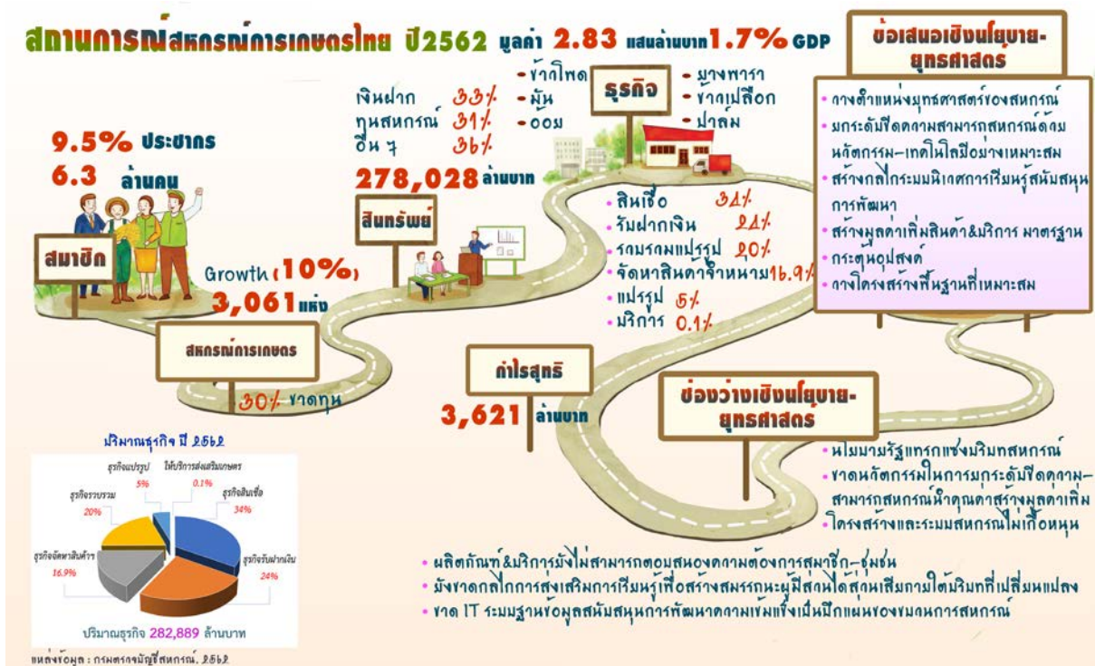
รูปที่ 3 สถานการณ์สหกรณ์การเกษตรไทย ปี 2562