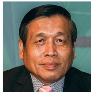
พลโท ดร.วีระ วงศ์สวรรค์ ประธานชสอ.