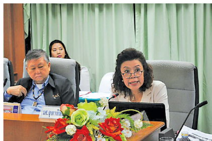
เวทีระดมความคิดเห็น “กรอบทิศทางเชิงยุทธศาสตร์การพัฒนากองการสหกรณ์ไทยในศตวรรษที่2” ร่วมกับภาคี