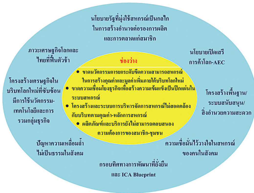
ประเด็นท้าทายและช่องว่างเชิงยุทธศาสตร์

ยังคงเป็นด้านสินเชื่อ รับฝากเงิน จัดหาสินค้ามาจำหน่าย รวบรวมผลผลิต และแปรรูป ส่วนธุรกิจส่งเสริมเกษตร ซึ่งเป็นธุรกิจที่อยู่ในกิจกรรมต้นน้ำ และกลางน้ำเท่านั้น ผลิตภัณฑ์แปรรูปส่วนใหญ่เป็นผลิตภัณฑ์แปรรูปเบื้องต้น เช่น ข้าวสาร ยางพารา (น้ำยาง ยางแท่ง) ส่วนธุรกิจจัดหา ยังคงพึ่งพาสินค้าที่ผลิตจากภายนอกสหกรณ์ มีสหกรณ์บางแห่งเริ่มผลิตสินค้าอุปโภค บริโภค (consumer good) บ้างแต่ยังคงเผชิญกับปัญหาด้านการตลาดการรับรองมาตรฐานผลิตภัณฑ์ที่เป็นสากลและค่านิยมของสมาชิกในการอุดหนุนผลิตภัณฑ์สหกรณ์ โดยเฉพาะอย่างยิ่งมูลค่าของธุรกิจส่งเสริมเกษตรและบริการ ซึ่งควรเป็นกิจกรรมและบริการที่มีความสำคัญเป็นอย่างยิ่งแต่กลับ