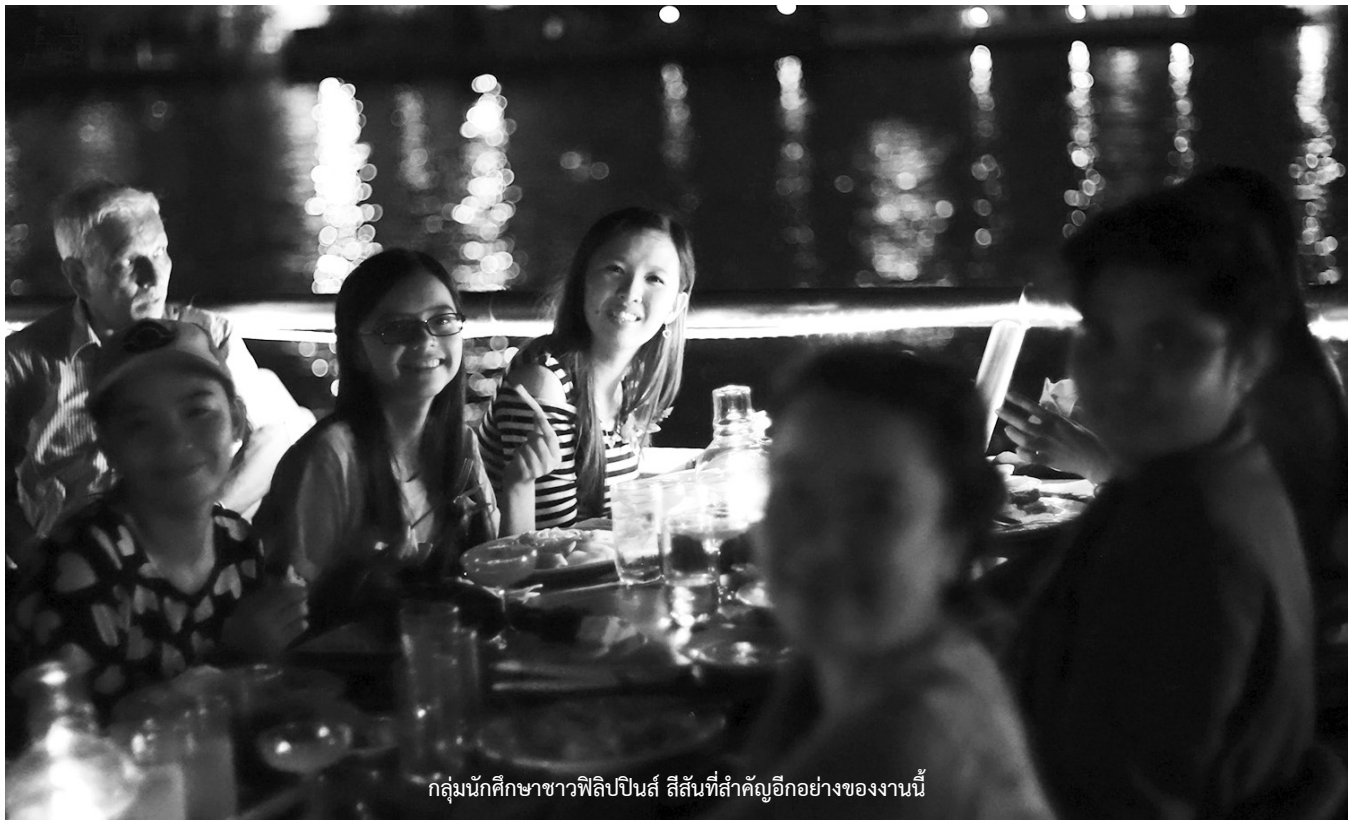
กลุ่มนักศึกษาชาวฟิลิปปินส์ ลิสันที่สำคัญอีกอย่างของงานนี้

ท้ายบทความนี้ ขอฝากคำถามไว้ สักหน่อยสำหรับสหกรณ์ที่จดทะเบียนใน สถาบันการศึกษา นั่นคือ สหกรณ์เหล่านี้ได้ ทำอะไรให้กับประชากรส่วนใหญ่ของสถาบัน นั้น ๆ แล้วหรือยังครับ.....ผมขอลาไป ด้วยภาพบรรยากาศครับ