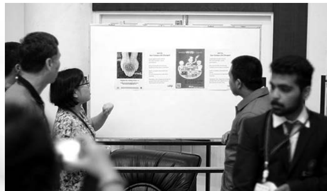
การนำเสนอโปสเตอร์ของนักศึกษาอินเดียถึงกิจกรรมที่พวกเขาทำ มีทั้งเด็ก ทั้งผู้ใหญ่ไปยืนฟัง