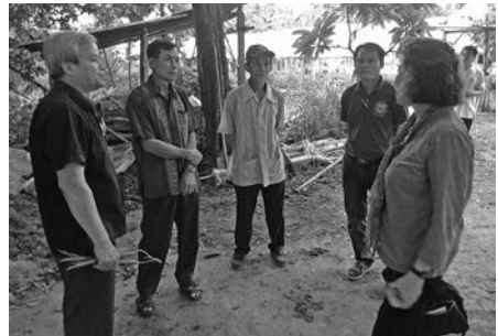
ศึกษาดูงานกลุ่มเกษตรกรผู้ปลูกผักอินทรีย์