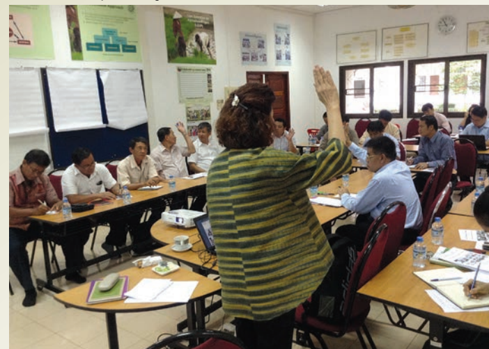
การมีส่วนร่วมของผู้บริหารและข้าราชการกรมส่งเสริมการเกษตรและสหกรณ์ ในการยกร่างแผนยุทธศาสตร์