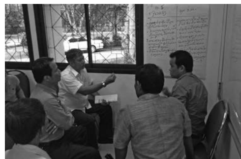
ภาพบรรยากาศของการมีส่วนร่วมของผู้บริหารและเจ้าหน้าที่ของกรมส่งเสริมการเกษตรและสหกรณ์