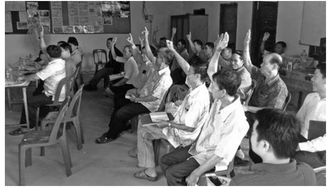
ภาพบรรยากาศของการมีส่วนร่วมของเกษตรกร ณ โรงเรียนชวนา เมืองธวัชชัย สปป.ลาว