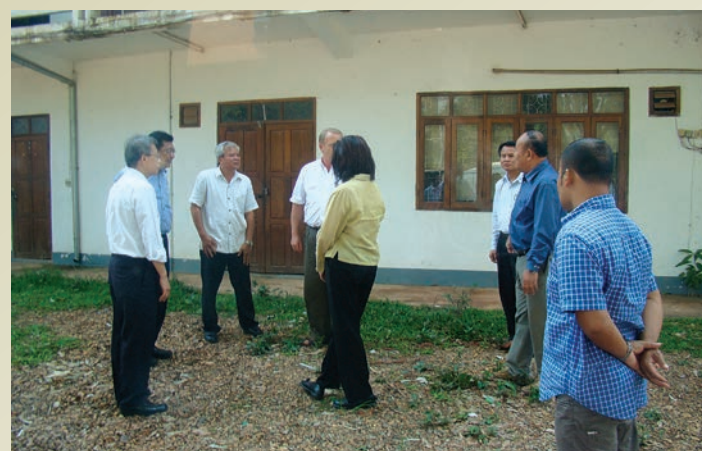
ท่านทูตชุมเจตน์ ผอ.สถาบันฯและหัวหน้าภาควิชาสหกรณ์ ร่วมประชุมกับทีมผู้บริหารกรมส่งเสริมการเกษตรและสหกรณ์ สปป.ลาว