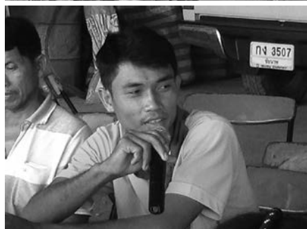
ชวานากลุ่มเกษตรกรบ้านคลองใหญ่ร่วมแลกเปลี่ยนเรียนรู้ในเวที

เกิดการรวมตัวกันเพื่อแก้ไขปัญหาหนี้สินของเกษตรกรที่มีสาเหตุ โดยปัจจุบันที่ประเภทต่าง ๆ ได้แก่ นาข้าว 3500 ไร่ ไร่มันสาปะหลัง 3800 ไร่ และ ไร่อ้อย ประมาณ 6000 ไร่ รวมทั้งหมดประมาณ 13,300 ไร่