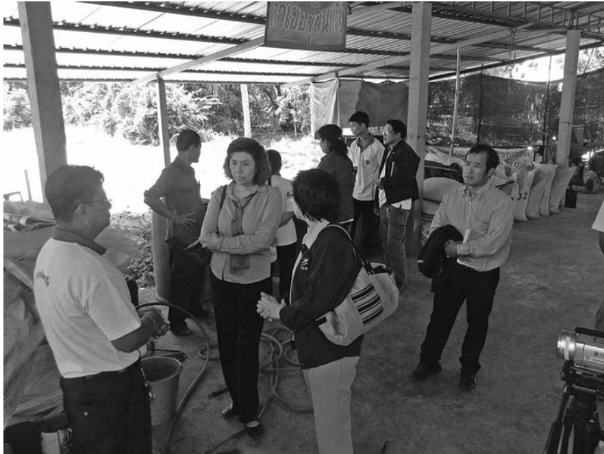
โรงผลิตปุ๋ยอินทรีย์ตราชวานามืออาชีพ