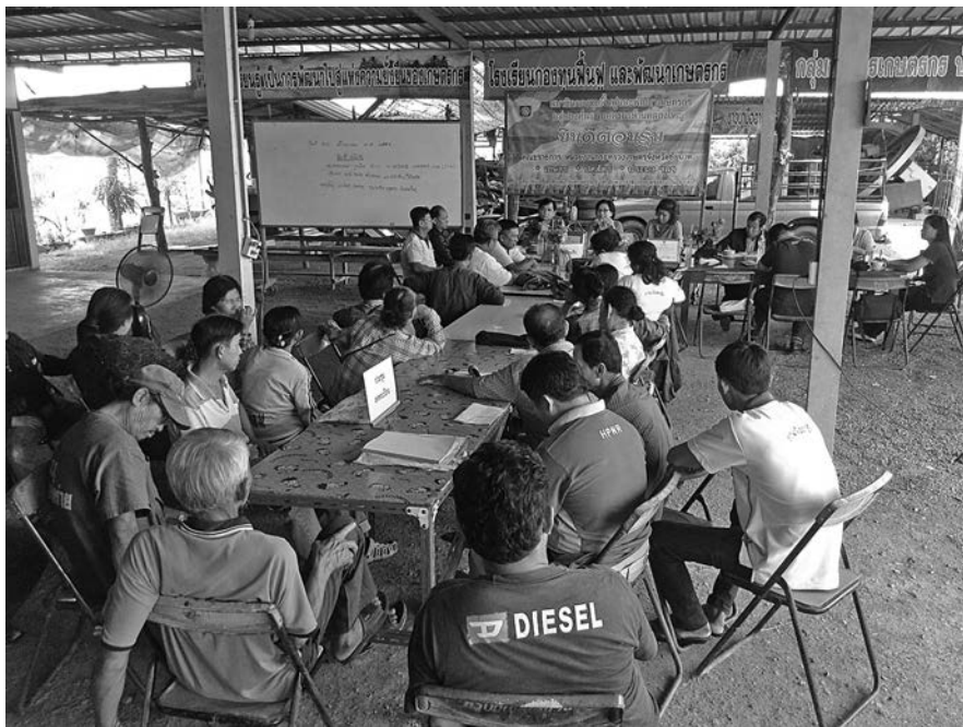
ชวานากกลุ่มเกษตรกรบ้านคลองใหญ่มาประชุมกันอย่างพร้อมเพรียง

แปลงใหญ่จึงไม่น่าจะใช่แค่การทำเกษตรในพื้นที่ขนาดใหญ่ มีแหล่งน้ำขนาดใหญ่ แต่บริหารจัดการแบบเดิม ๆ