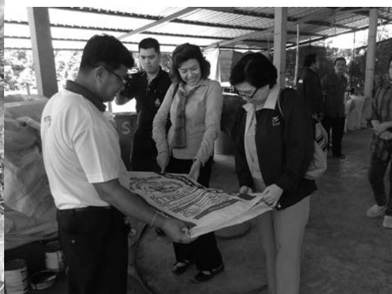
กลุ่มเกษตรกรผลิตปุ๋ยอินทรีย์ตราชวานา มีอาชีพใช้เอง