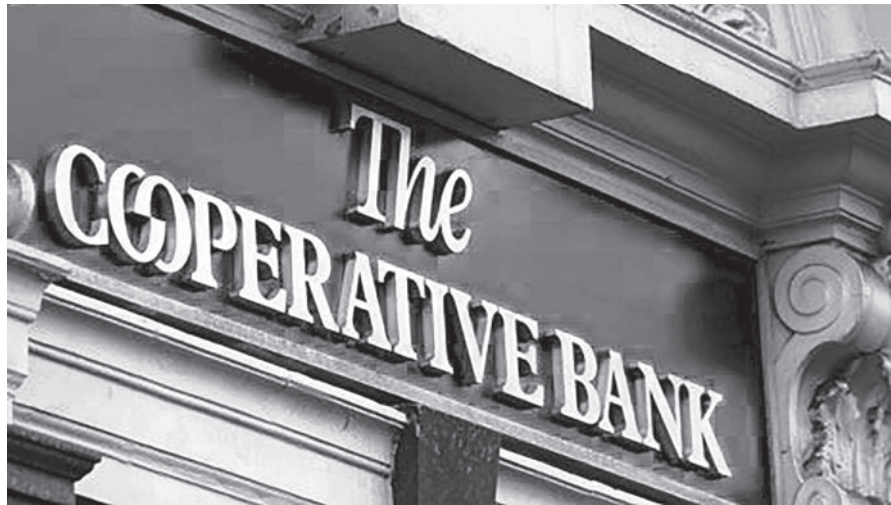
ธนาคารสหกรณ์ ประเทศอังกฤษ

กลุ่มผู้ถือหุ้นใหญ่ของธนาคารสหกรณ์ คือ กลุ่มธุรกิจสหกรณ์อังกฤษ โดยที่ธนาคารสหกรณ์ไม่เพียงแต่เป็นธนาคารชั้นนำในสหราชอาณาจักรแล้ว แต่ยังมีนโยบายในด้านจริยธรรม (Ethical Policy) ที่ให้ความสำคัญกับการให้บริการลูกค้า จนได้รับรางวัลธนาคารชั้นนำอย่างต่อเนื่องในอดีตมาหลายปี ข้อมูลในปี 2557 ธนาคารมีลูกค้าภายใต้โครงการจริยธรรม จำนวน 74,000 ราย