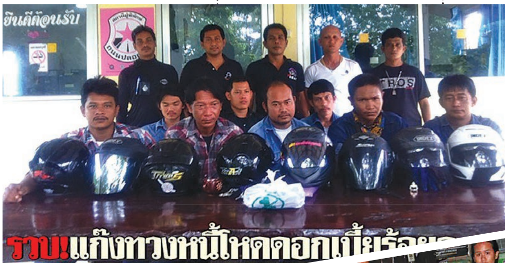
ชาวบ้านถูกแก๊งทวงหนี้ทำร้ายข้าวของ เนื่องจากไม่มีเงินใช้หนี้

ครัวเรือนต้องเผชิญกับปัญหานี้ นอกกรอบ ซึ่งมีมูลค่าสูงถึง 5 ล้านล้านบาท ซึ่งนี่คือเหตุผลสำคัญที่รัฐได้ออกมาใช้มาตรการ “นาโนไฟแนนซ์”