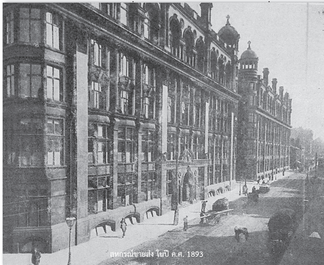
สหกรณ์ขายส่ง ในปี ค.ศ. 1893

หลังจากมีสภาพสหกรณ์แล้ว อีก 8-9 ปีที่ต่อมา ในปี 1881 ได้มีการ จัดสหกรณ์แปรรูปในภาคการเกษตรใน ประเทศเดนมาร์ค การจัดตั้งสหกรณ์ คนงานในประเทศฝรั่งเศส การก่อ