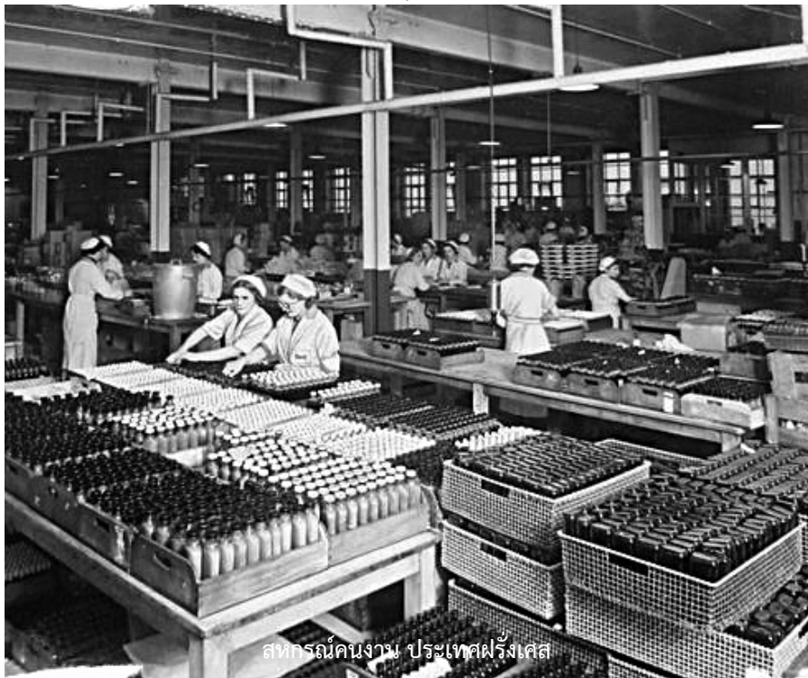
สหกรณ์คนงาน ประเทศฝรั่งเศส

ช่วงเวลาปี 1895 มีการตั้งสัมพันธ์ภาพสหกรณ์ระหว่างประเทศ (ICA) ในฐานะเป็นแม่ข่ายของสหกรณ์ของโลก และต่อมาได้ก็มีบทบาทสำคัญในการจัด