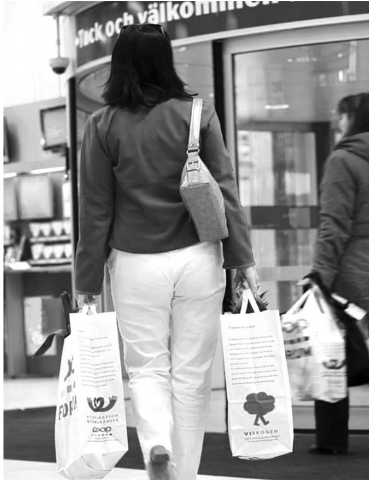
การรณรงค์การใช้ถุงผ้าของสหกรณ์ผู้บริโภคในเกาหลี

ปัจจุบันสหกรณ์การเกษตรมีแผนระดับชาติในการส่งเสริมการพัฒนาเกษตรภายใต้เครือข่ายสหกรณ์ ไปสู่เกษตรอินทรีย์ อันนี้ก็เป็นเรื่องของขับเคลื่อนการพัฒนาที่ยั่งยืนในด้านของสหกรณ์ ในอีกด้านหนึ่งในด้านของสิ่งแวดล้อม เดียวนี้มีการจัดตั้งสหกรณ์ปลูกป่า สหกรณ์สิ่งแวดล้อม สหกรณ์พลังงาน สหกรณ์ทางเลือก สหกรณ์ผลิตพลังงานด้วยกังหันลมในเยอรมนีอย่างนี้เป็นต้น อันนี้ก็แสดงว่าสหกรณ์ก็จะเป็นแกนนำสำคัญๆ หลายแห่ง สหกรณ์การเกษตร