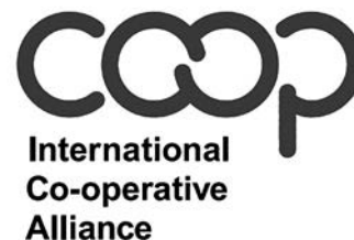
โลโก้ใหม่

รวมพลังกันจัดตั้งสมัชชาครั้งใหญ่ ประกาศ ปีสากลการสหกรณ์ในปี 2012 โดยสร้าง แคมเปญสหกรณ์วิสาหกิจสร้างโลกได้ดีกว่า โดยทุกประเทศโดยรัฐบาลทุกประเทศ ที่เป็นเครือข่ายของประชาชาติปวารณา ตัวที่จะประชาสัมพันธ์แนวทางการปฏิบัติ ที่ดีของสหกรณ์ในประเทศของตน อันนี้ ก็เป็นสิ่งที่เป็นที่มา หลังจากปีสากลแห่ง การสหกรณ์ผ่านไปก็มีการประชุมสรุป งานที่กรุงนิวยอร์ก ประเทศอเมริกาใน ช่วงปลายปี 2012 เดือนพฤศจิกายน ที่ ประชุมสรุปจะประกาศให้เป็นทศวรรษ แห่งการสหกรณ์โลกโดยการกำหนดช่วง เวลาตั้งแต่ปี 2553- 2563 โดยมีเข็มมุ่งใน การขับเคลื่อนวิสาหกิจสหกรณ์ให้เติบโต มากที่สุดและได้กำหนดแนวปฏิบัติในรูป พิมพ์เขียว ICA ที่เรียกว่า ICA Blueprint ICA Blueprint ซึ่งประกอบด้วยเสา หลักยุทธศาสตร์ 5 ประการ เสาหลัก ยุทธศาสตร์แรกมุ่งรณรงค์ให้ประชาคม มีส่วนร่วมสหกรณ์เพื่อนำไปสู่การเป็น เครื่องมือของประชาชนในการยกระดับ ฐานะการเป็นอยู่ของตนเองบนหลักการ สหกรณ์สากล เสาหลักยุทธศาสตร์ที่ 2 ในเรื่องของการทำหน้าที่เป็นผู้นำการ ขับเคลื่อนการพัฒนาที่ยั่งยืนบนสหกรณ์ ทั่วโลก ทำหน้าที่เป็นผู้นำการขับเคลื่อน แนวทางการพัฒนาที่ยั่งยืนมีสามเสาหลัก หนึ่งเศรษฐกิจเป็นธรรมมั่นคงมีเสถียรภาพ