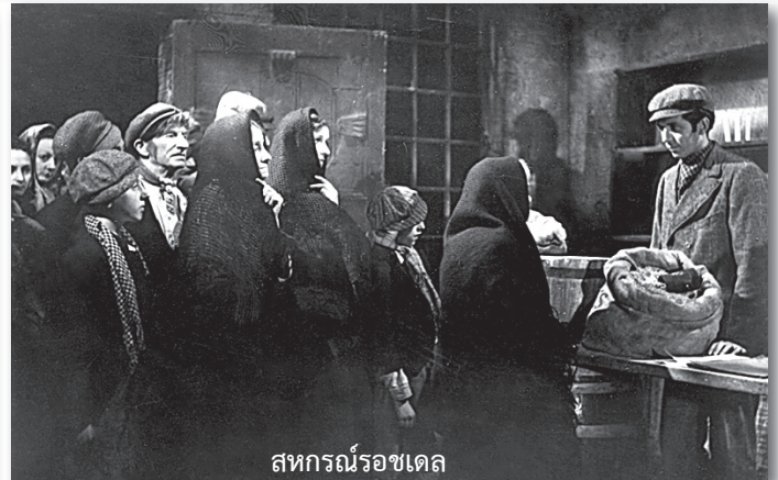
สหกรณ์ร็อคเดิล