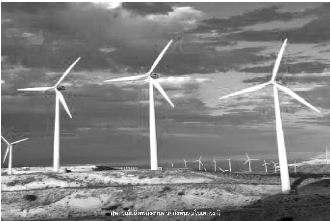
สหกรณ์ผลิตพลังงานด้วยกังหันลมในเยอรมนี

ICA Blueprint หรือพิมพ์เขียว สำหรับยุทธศาสตร์ในทศวรรษแห่งการ สหกรณ์ระหว่างปี 2011 ปี 2020 ได้