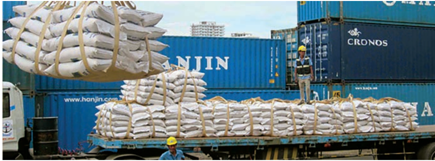
การขยายตัวของปริมาณการส่งออกข้าวหอมของกัมพูชาที่เพิ่มขึ้นอย่างรวดเร็ว

การปลูกข้าวหอมในกัมพูชาโดยเฉพาะข้าวหอมผกามะลิและผกากล้าดวงมีปลูกกันมากในจังหวัด เสียมเรียบ พระตะบอง โพลิน บันเตียนมีชัย กำปงชะนำ กำปงสปีอ ตาแก้ว และเปรเวง นอกจากนี้ในพื้นที่ชลประทานของหลายจังหวัดในกัมพูชามีการปลูกข้าวพันธุ์ Sen Kra-ob และพันธุ์ Sen Pidao ซึ่งเป็นข้าวหอมพันธุ์ไม่ไวแสงปลูกได้ทั้งนาปีและนาปรัง ข้าวทั้งสองพันธุ์ดังกล่าวเป็นข้าวลูกผสมที่อยู่ในกลุ่มข้าวหอมอย่างเช่นข้าวปทุมธานี 1 ของไทยแต่มีคุณภาพเป็นรองกว่าข้าวผกามะลิและผกากล้าดวงโดยเป็นสินค้าข้าวหอมในตลาดรองจากข้าวหอมในตลาดพรีเมียม