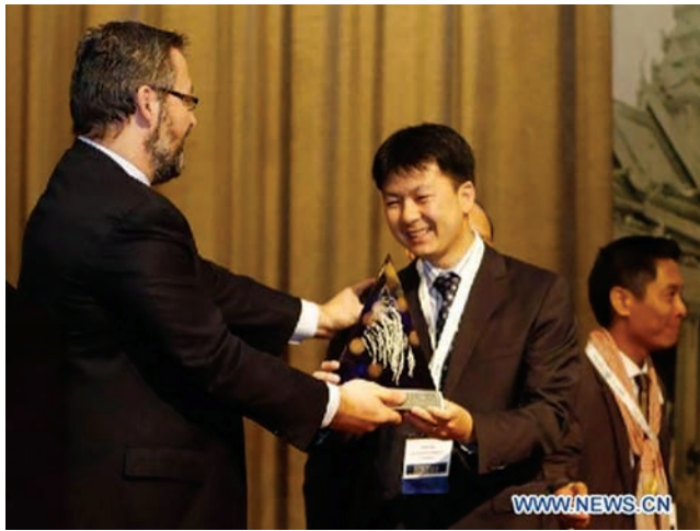
ข้าวหอมผกามะลิและผกาลำดวนของกัมพูชาได้รับรางวัลข้าวหอมที่ดีที่สุดในโลก

สนับสนุนในการจัดตั้งโรงสีเพื่อการแปรรูปและความร่วมมือเพื่อการส่งออกข้าวผ่านทางประเทศเวียดนาม อีกทั้งรัฐบาลเวียดนามได้ลงนามในข้อตกลงกับรัฐบาลกัมพูชาในการยกเว้นการเก็บภาษีนำเข้าข้าวหอมจากกัมพูชา ข้อตกลงดังกล่าวได้มีส่วนช่วยสนับสนุนให้เกิดการขยายตัวของการส่งออกทั้งข้าวหอมของกัมพูชาและข้าวเปลือกผ่านทางชายแดนประเทศเวียดนามเพื่อให้ผู้ประกอบการโรงสีในเวียดนามนำไปแปรรูปและการส่งออก เพราะข้าวเปลือกเจ้าของกัมพูชามีคุณภาพที่ดีกว่าข้าวเปลือกเจ้าของเวียดนามโดยเฉพาะข้าวพันธุ์พื้นเมืองในหลายพันธุ์ที่มีระดับอะไมโลสปานกลาง การส่งออก