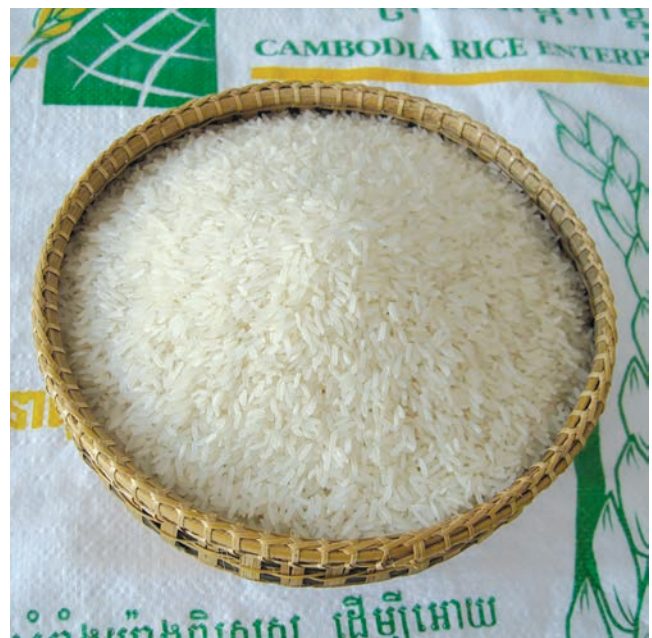
ข้าวหอมผกามะลิ กัมพูชา

การขยายตัวของ การส่งออกข้าวหอมของกัมพูชาที่เพิ่มขึ้นอย่างก้าวกระโดดนั้นปัจจัยหนึ่งเป็นเพราะข้าวหอมของกัมพูชาสามารถทดแทนได้ดีกับข้าวหอมมะลิไทย นอกจากนี้ยังมีปัจจัยเรื่องชื่อเสียงจากการชนะประกวดข้าวหอมโลกรวมอยู่ด้วย ปัจจัยเรื่อง ระดับราคาข้าวหอมของกัมพูชาในตลาดส่งออกอยู่ในระดับที่ต่ำกว่าราคาข้าวหอมมะลิจากไทยถึงร้อยละ 20 และรวมถึงการได้สิทธิพิเศษทางภาษีของกัมพูชาในการส่งข้าวหอมไปยังตลาดสหภาพยุโรปเพราะอยู่ในกลุ่มของประเทศมีรายได้ต่ำ