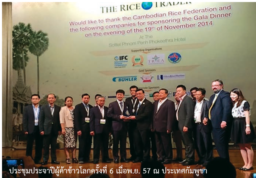
ประชุมประจำปีผู้ค้าข้าวโลกครั้งที่ 6 เมื่อพ.ย. 57 ณ ประเทศกัมพูชา

กัมพูชามีผลผลิตข้าวประมาณปีละ 9 ล้านตันข้าวเปลือกในปี 2556 หรือประมาณ 4.7 ล้านตันข้าวสารในจำนวนนี้ร้อยละ 78 หรือประมาณ 3.7 ล้านตันข้าวสารใช้บริโภคภายในประเทศและมีการส่งออกประมาณ 1 ล้านตัน ในจำนวนนี้เป็นการส่งออกข้าวหอมประมาณหนึ่งในห้าหรือ 0.18 ล้านตันอย่างไรก็ตามการส่งออกข้าวหอมของกัมพูชาได้เพิ่มขึ้นมาเป็น 0.28 ล้านตันในปี 2557 ในขณะที่ปริมาณการส่งออกโดยรวมเพิ่มขึ้นเป็น 1.2 ล้านตัน