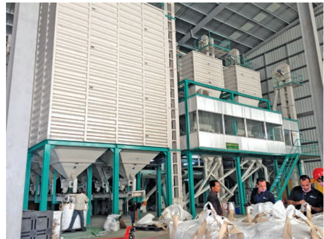
การพัฒนาศักยภาพและกำลังการผลิตของโรงสีกัมพูชา

ขณะเดียวกันกัมพูชาได้มีความร่วมมือกับรัฐบาลเวียดนามในเรื่องธุรกิจการค้าข้าว โดยได้ร่วมกันจัดตั้งบริษัทที่เรียกว่า CAVIFOOD หรือ Cambodia Vietnam Foods Company เพื่อ