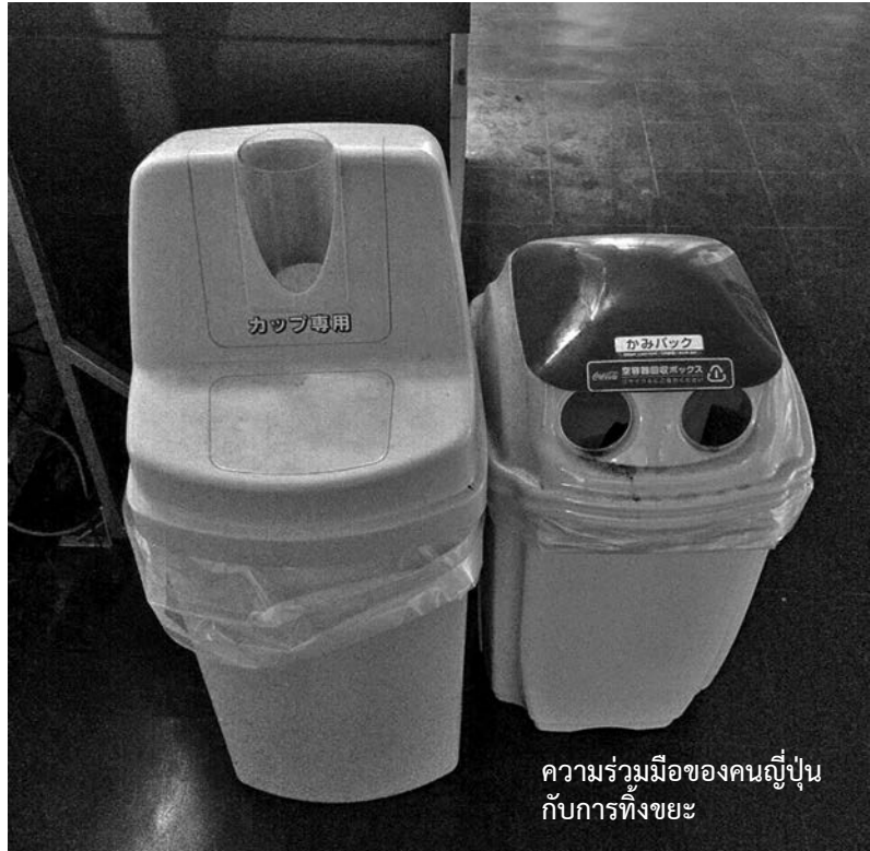
ความร่วมมือของคนญี่ปุ่นกับการทิ้งขยะ

บ้านเรา ทุกอย่างเทใส่ถุงดำ นำไปทิ้งไว้ที่จุดทิ้ง ก็ถือว่าเรียบร้อยแล้ว แต่ที่นี้ “ถุงขยะมีมูลค่า” และ “แยกสี” ครับ ถุงขยะที่ผมใช้มีสองสีครับ สีแดง (สำหรับทิ้งขยะเผาได้: เศษอาหาร กระดาษ เป็นต้น) และสีฟ้า (ขยะรีไซเคิล: ขวดพลาสติก แผงโซลาร์เซลล์ ขวดแก้ว กระป๋อง) และขวดพลาสติกกับขวดแก้ว และกระป๋องต้องแยกออกจากกันด้วยนะครับ ซึ่งแปลว่า ต้องใช้ถุงขยะจริงๆ ประมาณ 4 ใบ แต่ปัญหามันอยู่ที่ราคา ค่ามัดของถุงนี้แหละครับ ถุงขยะ 20 ลิตร 10 ใบมีราคา 400 เยน หรือ คือ ประมาณ 120 บาท คำถามคือ แล้วทำไมเค้าไม่ใช้ถุงก๊อปแก็ป ใส่ขยะแทนที่จะใช้ถุงสีๆแบบนี้ล่ะครับ? เพื่อนญี่ปุ่นผมตอบเต็มปากเต็มคำว่ามันคือ “หน้าที่ ที่ทุกคนต้องร่วมมือกันทำ” ! พุดถึงถุงก๊อปแก็ป เลยขอพุดต่อยอดอีกซัก