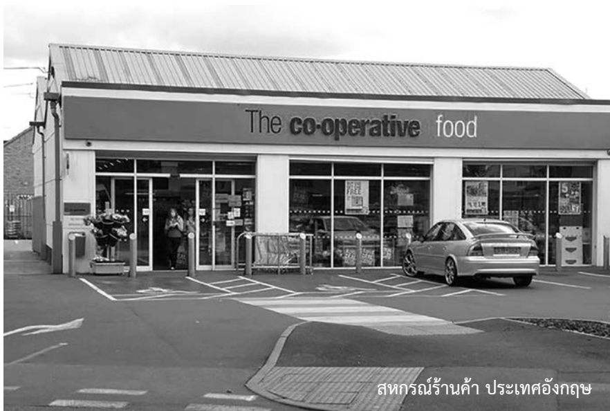
สหกรณ์ร้านค้า ประเทศอังกฤษ

วันนี้ผมนั่งทำงานบนโต๊ะสี่เหลี่ยม ที่มีเพียงแก้วกาแฟ เอกสารการเรียนกอง เป็นภูเขา และคอมพิวเตอร์อีกหนึ่งตัว กำลังนึกว่าจะเขียนบทความอะไรส่งให้ วารสารดี จนกระทั่งเดินไปเข้าห้องน้ำ แล้วก็เจอป้ายกระดานเขียนว่า “กรุณา ใช้ทิชชู่อันเก่าให้หมดก่อน จึงใช้อันใหม่ เพื่อเป็นการ*ร่วมกัน*รักษาสิ่งแวดล้อม” ประกอบกับวันนี้ที่เริ่มเขียนบทความฉบับ นี้ตรงกับวันที่ 26 กุมภาพันธ์ ซึ่งตรงกับ วันสหกรณ์แห่งชาติ จึงเป็นแรงบันดาลใจ ให้ผมเขียนบทความฉบับนี้