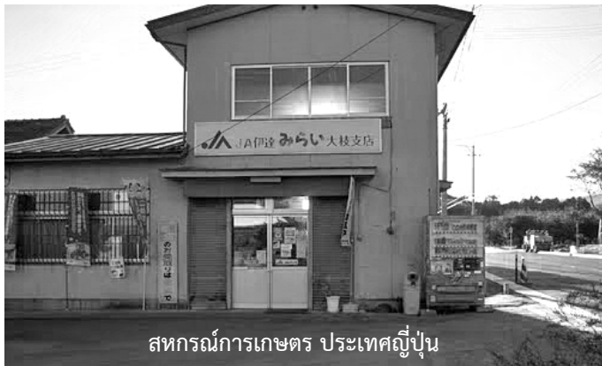
สหกรณ์การเกษตร ประเทศญี่ปุ่น