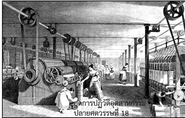
ยุคการปฏิวัติอุตสาหกรรม ปลายศตวรรษที่ 18