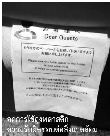
ลดการใช้ถุงพลาสติก ความรับผิดชอบต่อสิ่งแวดล้อม