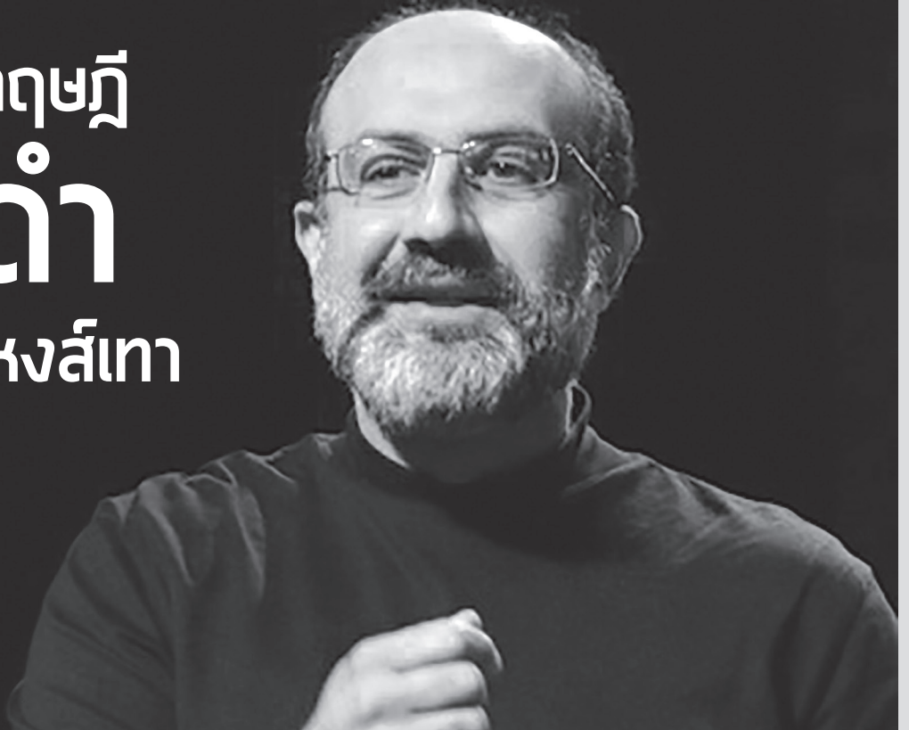
Nassim Nicholas Taleb: ตาเล็บ

สถานการณ์ในปัจจุบันที่คนทั่วโลกตระหนักเห็นข้อเท็จจริงที่ว่า ตลาดเสรี (Free market) นั้น ไม่อาจตอบโจทย์แก่คนส่วนใหญ่ในสังคมได้ และหากรัฐไม่กำกับดูแลผู้ที่มีอำนาจต่อรองในตลาดได้ ปัญหาจริยธรรมวิบัติ (Moral hazard) ย่อมเติบโตและเป็นภัยต่อคนชั้นกลาง ผู้ประกอบการรายย่อยและเกษตรกรซึ่งเป็นคนส่วนใหญ่ในประเทศ