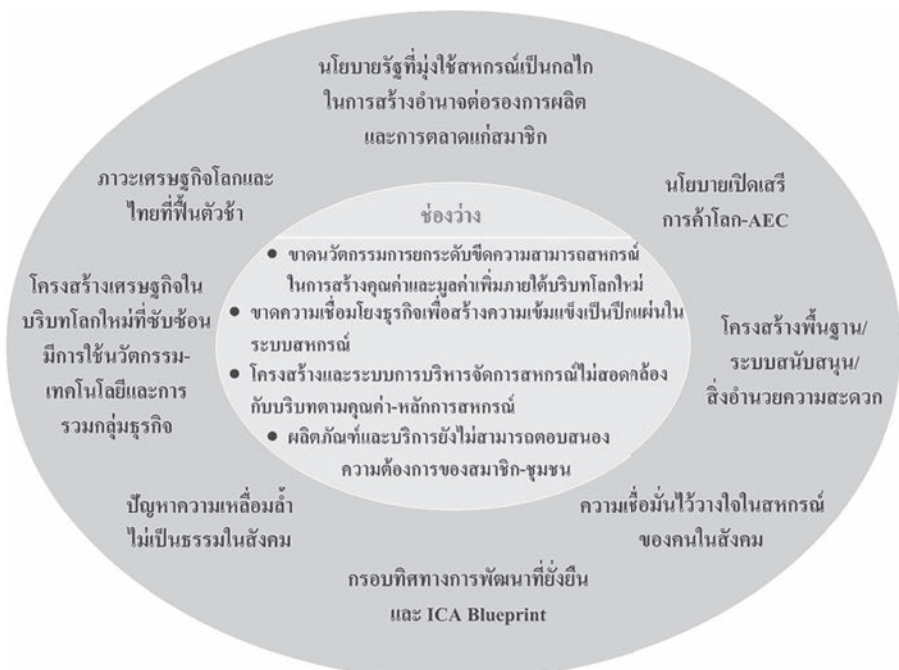
ประเด็นท้าทายและช่องว่างเชิงยุทธศาสตร์

• โครงสร้างพื้นฐาน ระบบสนับสนุนและสิ่งอำนวยความสะดวกไม่ว่าจะเป็นเรื่องการคมนาคมขนส่ง ระบบข้อมูลข่าวสาร กฎหมาย และกฎระเบียบที่เกี่ยวข้องกับการพัฒนาธุรกิจสหกรณ์ ยังไม่เอื้อต่อ อัตลักษณ์ของสหกรณ์อย่างควรจะเป็น