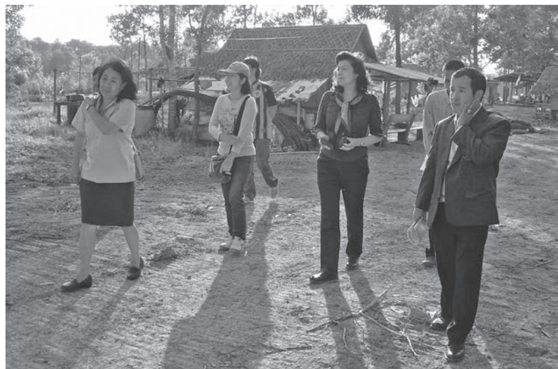
การนำงานวิจัยไปพัฒนาหลักสูตรการเรียนรู้ตลอดชีวิตของเกษตรกรรุ่นใหม่