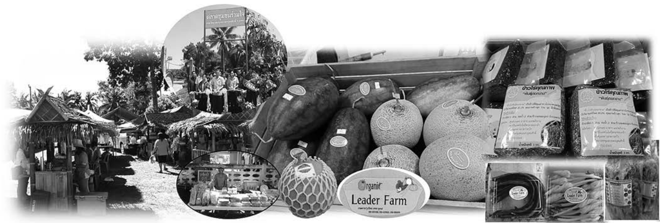
ผลผลิตของเกษตรกรรุ่นใหม่ไปจำหน่ายในตลาดชุมชนร่วมใจ