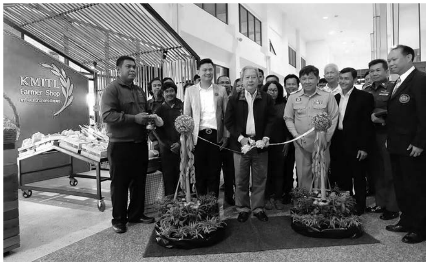
ท่านพลเอกสุรยุทธ์ จุลานนท์ให้เกียรติเป็นประธานเปิดร้าน Farmer Shop by KMITL ณ สนามบินชุมพร

ชุมพร ที่เน้นการเรียนรู้ด้วยการปฏิบัติจริง จนเกิดต้นแบบฐานเกษตรอินทรีย์ การผลิตพืชผักปลอดภัย การปุ๋ยอินทรีย์ การผลิตพันธุ์พืช พันธุ์ข้าวไร่และข้าวไร่อินทรีย์เพื่อบริโภค