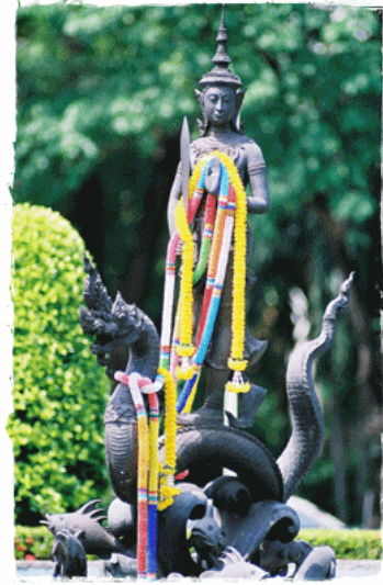
พระพิรุณทรงนาค