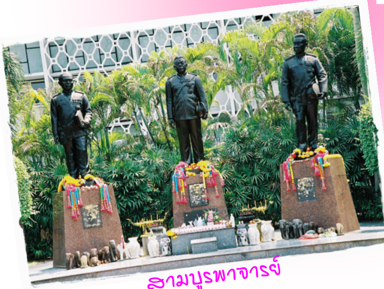
สามบูรพาจารย์

สถาบันวิชาการด้านชนกรรม มหาวิทยาลัยเกษตรศาสตร์ ชั้น 2 อาคารวิจัยและพัฒนา มก. 50 ถนนพหลโยธิน ลาดยาว จตุจักร กรุงเทพฯ 10900 โทรศัพท์/โทรสาร 02-9406300 ต่อ 2067