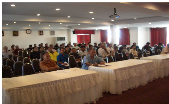
เวทีชี้แจงให้กลุ่มองค์กรประชาชนต่างๆ