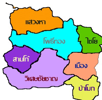
ภาพที่ 2 การแบ่งเขตการปกครองของจังหวัดอ่างทอง

การปกครองของจังหวัดอ่างทอง แบ่งออกเป็น 7 อำเภอ 73 ตำบล 513 หมู่บ้าน 10 เทศบาล 1 องค์การบริหารส่วนจังหวัด 47 องค์การบริหารส่วนตำบล และ 19 สภาตำบล