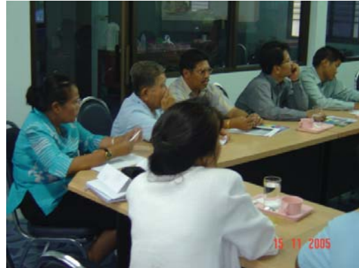
จัดประชุมเสริมความรู้ด้านการตลาดเกษตรให้กับผู้บริหารและผู้จัดการสหกรณ์การเกษตร โดยวิทยากรจากตลาดซื้อขายสินค้าเกษตรล่วงหน้าแห่งประเทศไทย