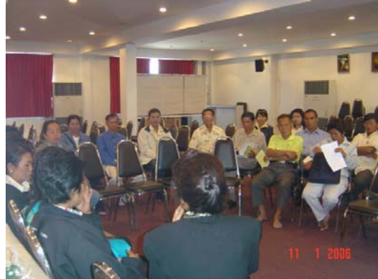
ระดมความคิดเห็นเพื่อเชื่อมโยงเครือข่ายระหว่างสหกรณ์และกลุ่ม/องค์กรต่างๆ