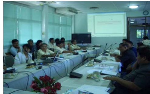
เวทีชี้แจงให้ผู้นำสหกรณ์และกลุ่มเกษตรกร