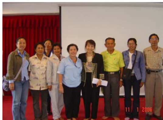
ผู้นำกลุ่มที่แสดงความสนใจร่วมเครือข่ายผลิต และแปรรูปกล้วยน้ำว้าพันธุ์มะลิช่อง