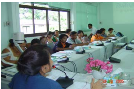
เวทีชี้แจงให้ผู้นำกลุ่มสตรีสหกรณ์

การดำเนินงานในขั้นตอนที่ 2 ตามที่กล่าวมาข้างต้นนี้ คณะผู้วิจัยได้ดำเนินการระหว่างวันที่ 13 ตุลาคม 2548 ถึง วันที่ 24 ตุลาคม 2548 มีผู้นำสหกรณ์และกลุ่มองค์กรฯ ที่เป็นเป้าหมายเข้าร่วมประชุมทั้งสิ้น 131 คน จาก 117 สหกรณ์/กลุ่ม มีผู้นำจาก 75 สหกรณ์/กลุ่มที่แสดงความสนใจจะเข้าร่วมในโครงการฯ ดูรายละเอียดการดำเนินงานในตารางที่ 28 (ดูรายชื่อกลุ่มที่เข้าร่วมประชุมในภาคผนวก )