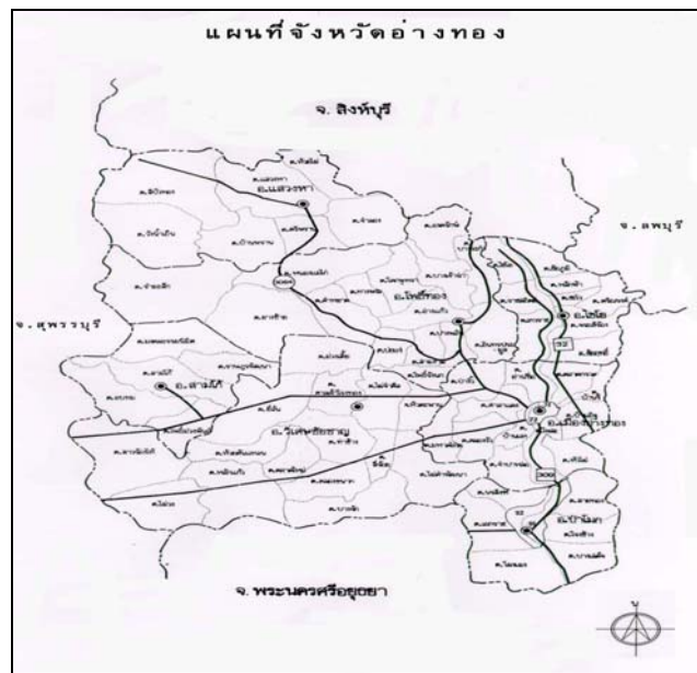
ภาพที่ 1 ที่ตั้งและอาณาเขตของจังหวัดอ่างทอง