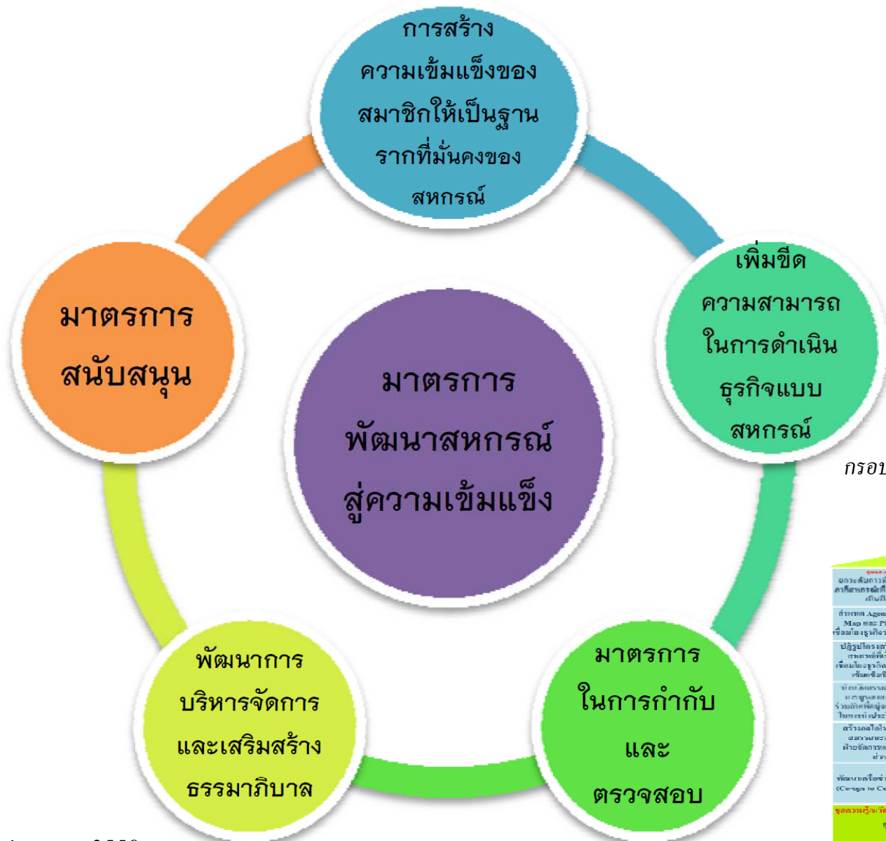
กรอบทิศทางเชิงยุทธศาสตร์การพัฒนารสหกรณ์ไทย ในท่วงเวลาท้าวสู่ศตวรรษที่ 2