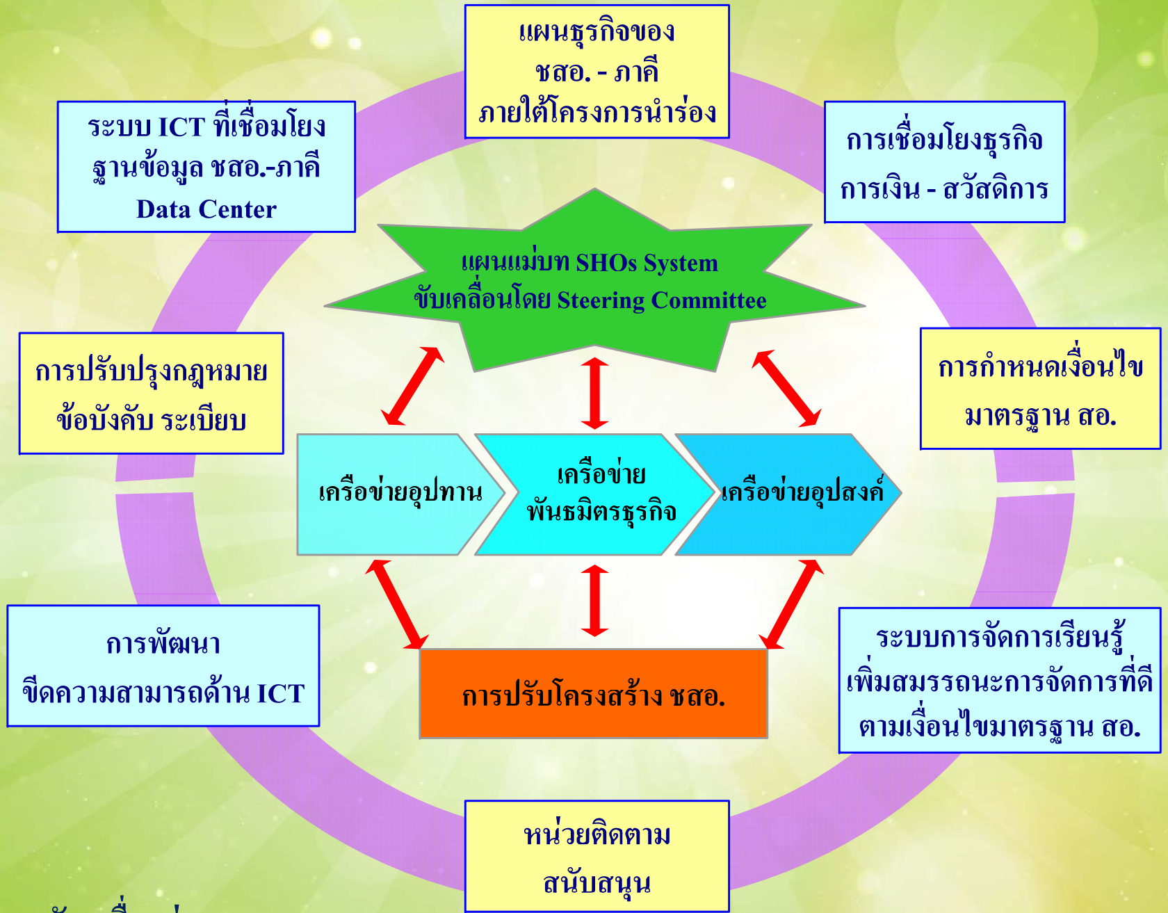
กรอบการขับเคลื่อนสู่ SHO's System