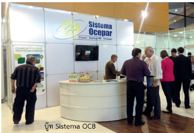
บู๊ท Sistema OCB

แสดงผลผลิตภัณฑ์ของขบวนการสหกรณ์บราซิล ซึ่ง SESCOOP ในฐานะที่เป็นองค์กรให้การสนับสนุนด้านการอบรมเป็นเจ้าภาพ นำเสนอผลิตภัณฑ์ของสหกรณ์มากกว่า 200 รายการในงาน สินค้าส่วนใหญ่เป็นผลิตภัณฑ์แปรรูปจากวัตถุดิบในประเทศที่สำคัญ ได้แก่ กาแฟ ชา น้ำตาล ผลิตภัณฑ์