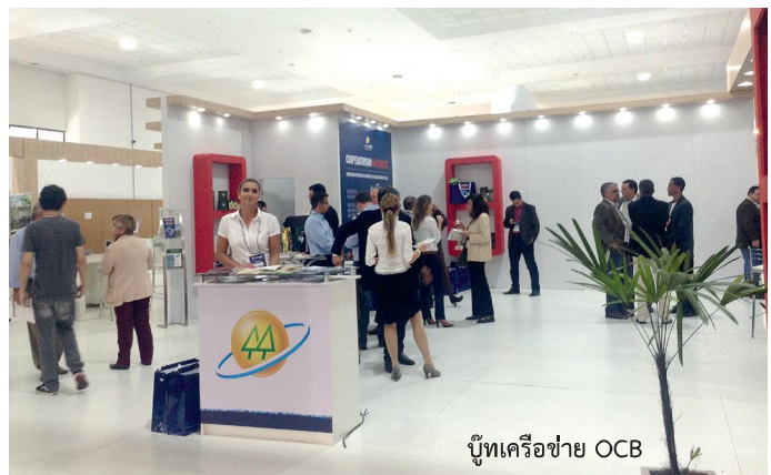
บู๊ทเครือข่าย OCB

ระบบของ OCB ครอบคลุมในหลาย area ได้แก่ 1) ด้านการเกษตร (กาแฟ ถั่วเหลือง) 2) ด้านเครดิต ดำเนินการร่วมกับธนาคารสหกรณ์ ได้แก่ BANCOOP และ BANSICRED 3) ด้านแรงงาน ซึ่งปัจจุบันกลายเป็นทางเลือกของกลุ่มคนยากจน และ