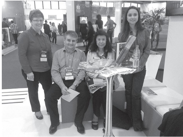
กิจกรรมของสหกรณ์ Unimed