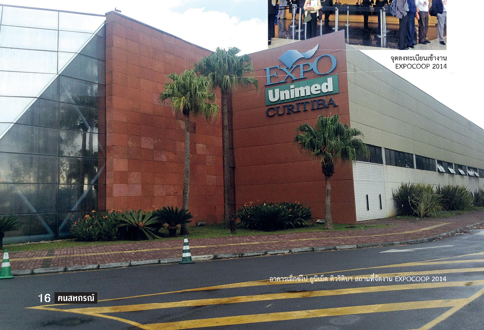
อาคารเอ็กซ์โป ยูนิเม็ด คิวิริบา สถานที่จัดงาน EXPOCOOP 2014