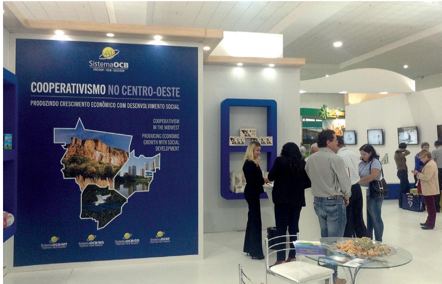
บู๊ทแสดงพื้นที่ดำเนินงานในด้านต่าง ๆ ของเครือข่าย OCB

คนว่างงาน โดยการจัดตั้งสหกรณ์ขนาดเล็ก 4) ด้านการรักษาพยาบาล ซึ่งปัจจุบันจัดตั้งเป็นองค์กรที่ให้บริการด้านสาธารณสุขที่มีผู้ใช้บริการถึง 11 ล้านคน 5) ด้านผู้บริโภคร ปัจจุบันมีสมาชิกกว่า 100 คน 6) ด้านเกษตรสถาน 7) ด้านโครงสร้างพื้นฐาน และ 8) ด้านการผลิต