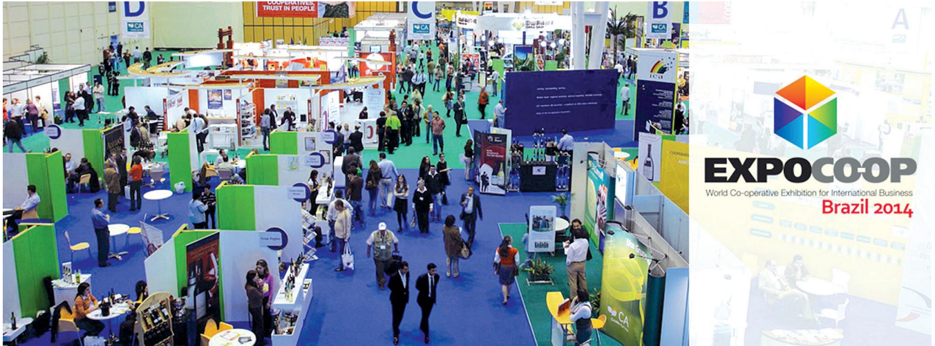
บรรยากาศในงาน EXPOCOOP 2014 ณ เมืองควิริติบา ประเทศบราซิล