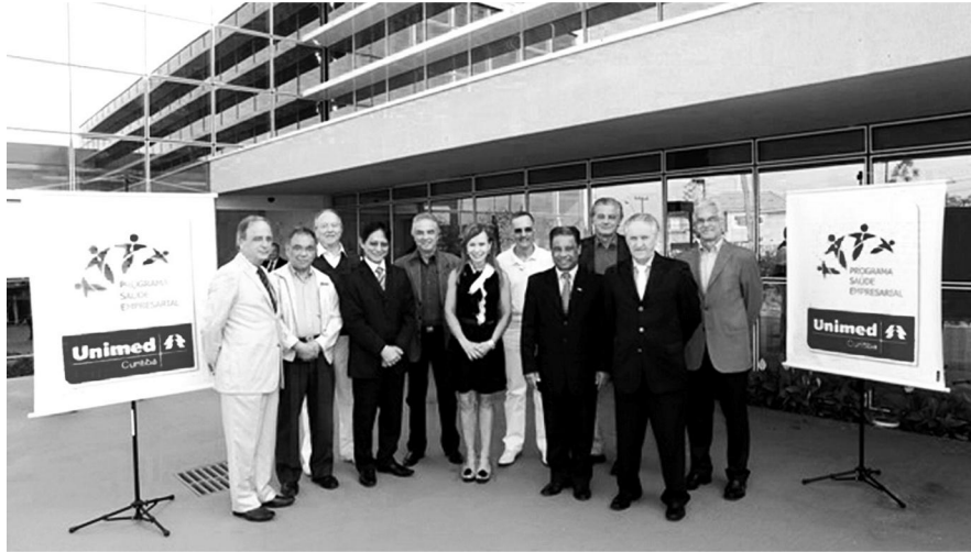
คณะผู้บริหารของสหกรณ์ Unimed