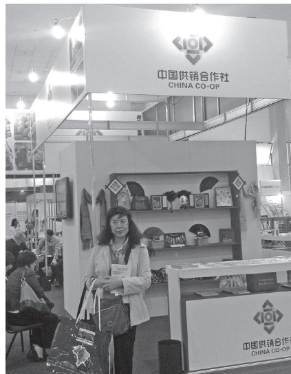
บูท China Coop Inter Business บริษัทต่าง ๆ

บูท China Coop Inter Business แสดงผลิตภัณฑ์ของขบวนการสหกรณ์ที่สำคัญ ได้แก่ ชาจีน ชาเขียว เห็ดต่าง ๆ ตลอดจนกิจการนำเข้า ส่งออกสินค้าอุปโภค