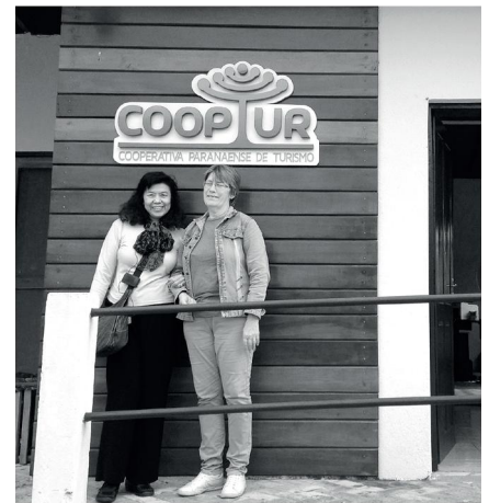
สำนักงาน COOPTUR