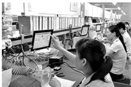
กิจกรรมของสหกรณ์ Unimed

เริ่มตั้งแต่ปี 1967 UNIMED บราซิล เป็นศูนย์บริการสุขภาพเอกชนที่ใหญ่ที่สุดในโลก มีส่วนแบ่งการตลาดในระบบวางแผนสุขภาพ หนึ่งในสามของบราซิลเพื่อสร้างคุณค่าสหกรณ์ UNIMED ได้วางแผนด้านความรับผิดชอบต่อสังคมระดับชาติในปี 2001 โดยมีจุดมุ่งหมายเพื่อดำเนินการด้านความรับผิดชอบต่อสังคม