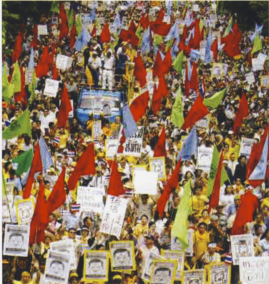
การเรียกร้องความเป็นธรรม

อย่างไรก็ตาม ตัวแปรสำคัญที่จะทำให้เป้าหมายการพัฒนาแห่งสหประชาชาติ บรรลุเป้าหมายได้นั้น ย่อมขึ้นมากับผู้นำการเมืองในแต่ละประเทศว่าจะมองเห็นความสำคัญของคนส่วนใหญ่มากกว่าอำนาจเงินตราของบรรษัทพันธมิตร ที่มีมูลค่าธุรกิจมากกว่า 2 ล้านล้านเหรียญต่อวัน ดังจะเห็นได้จากบรรยากาศของขบวนการต่อสู้เพื่อความเป็นธรรมของโลก นับตั้งแต่ การเดินขบวนต่อต้านองค์การการค้าโลก ในปี 1999 ที่ซีแอตเทิล การต่อต้านในครั้งนั้นเป็นการริเริ่มและร่วมมือกันระหว่างองค์กรต่างๆ ทั่วโลกที่มีเครือข่ายเหนียวแน่นขึ้นทุกที การประชุมเวทีสังคมโลก (World Social Forum) ประจำปี ได้กลายเป็นทางเลือกใหม่ เชิงสัญลักษณ์ที่มีความสำคัญลึกซึ้ง เมื่อเทียบกับการพบปะพูดคุย กันรายปีของบรรดานักธุรกิจ นักการเมือง แต่ภาพสะท้อนที่น่านสนใจยิ่งกว่าดูเหมือนจะเป็นกิจกรรมตั้งแต่ระดับท้องถิ่นจนถึงระดับชาติที่หลากหลาย แต่มีเป้าหมายไปในทิศทางของการรณรงค์ให้เกิดความเท่าเทียม