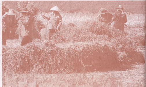
ความลำบากยากจนของชาวนาไทยในอดีต

การผลิตเชิงการค้าและการขยายการผลิตในระดับไร่นาของครัวเรือนภาค หลังการทำสนธิสัญญาเบาว์ริง (Bowring Treaty) [กับอังกฤษ ได้กระตุ้นให้ค เรือนชาวนาเกิดความต้องการเงินทุนเพิ่มเติม ทั้งเพื่อการปรับปรุงที่ดิน การจัดห ปัจจัยการผลิต ตลอดจนเครื่องมือและอุปกรณ์การเกษตร เพราะเป็นโอกาสที่ ชาวนาจะเพิ่มทุนรายได้ให้กับครัวเรือนจากการขยายการผลิตเพื่อการค้า อันเป็น ผลจากความต้องการข้าวที่มีมากขึ้นจากการขยายตัวของตลาดส่งออกในขณะนั้น ในอดีตเมื่อถึงฤดูเพาะปลูก ชาวนาที่ต้องการเงินทุนจึงต้องพึ่งพาเงินกู้จาก นายทุ ผู้มีฐานะในหมู่บ้านหรือพ่อค้าผลิตผล ซึ่งเป็นเงินกู้จากแหล่งเอกชนหรือเรียกกั ทั่วไปว่า “เงินกู้นอกระบบ” ทั้งนี้ เพราะบุคคลเหล่านี้มีเงินสดอยู่ในมือ ขณะ ชาวนาไม่มีเงินสดในมือ อีกทั้ง ในยามเดือดร้อน หรือเจ็บป่วย ก็ต้องอาศัยพึ่งพ ผู้ให้กู้นอกระบบและญาติพี่น้อง เพราะเป็นกลุ่มบุคคลในชุมชนที่แยกกลุ่มเดียว ที่มีความใกล้ชิดพอพึ่งพากันได้ เพราะมีความจำเป็นเร่งด่วน