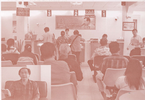
การให้บริการกู้ยืมเงินแก่เกษตรกร

หลักทรัพย์อย่างอื่นเป็นหลักประกัน อย่างไรก็ตามแนวทางในการจัดตั้งธนาคารให้กู้ยืมแห่งชาตินั้น แม้จะไม่ได้มีการจัดตั้งขึ้นในขณะนั้น แต่ในระยะต่อมาได้มีการจัดตั้งธนาคารเพื่อการเกษตรและสหกรณ์การเกษตร (ธ.ก.ส.) ในปี 2509 ทั้งนี้เพื่อให้เป็นแหล่งสินเชื่อและให้กู้ยืมเงินแก่พี่น้องชาวนาที่ขาดแคลนเงินทุนในการทำเกษตร เมื่อมีการจัดตั้งธนาคาร ธ.ก.ส. ขึ้นแล้วได้มีการรวบรวมธนาคารเพื่อการเกษตรเข้ากับการดำเนินงาน