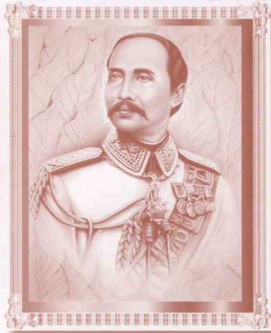
พระบาทสมเด็จพระจุลจอมเกล้าเจ้าอยู่หัว รัชกาลที่ 5