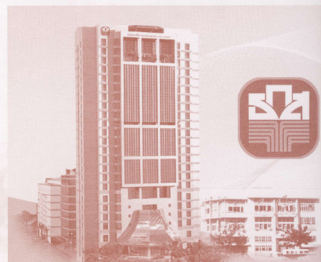
ธนาคารเพื่อการเกษตรและสหกรณ์การเกษตร