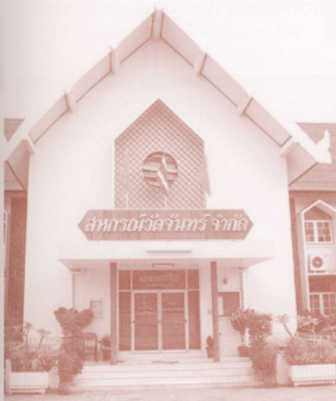
สหกรณ์หาทุนวัดจันทรินอจกัดลินใช้ : สหกรณ์แห่งแรกของประเทศไทย

การจัดตั้งสหกรณ์หาทุนในยุคนั้น ถือได้ว่าเป็นจุดเริ่มต้นของแหล่งให้กู้ยืมสถาบัน 6 และเป็นการให้กู้ยืมเพื่อกิจกรรมการเกษตรแก่สมาชิกสหกรณ์ได้กู้ยืมเงินไปเป็นทุนรอนในการประกอบ