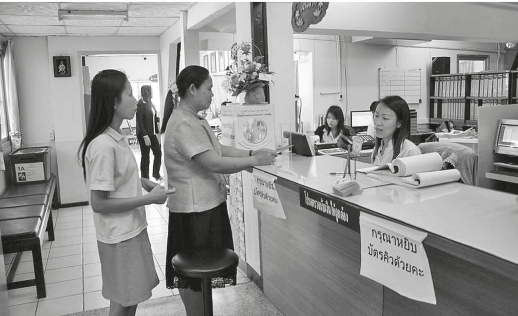
เงินรับฝากจากสมาชิกสหกรณ์