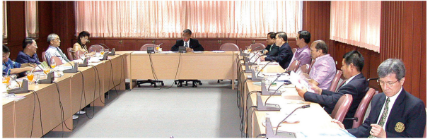
การประชุมคณะกรรมการประจำสถาบันฯเมื่อปี 2548

แม้การดำเนินการจัดและให้บริการหลักสูตรเปาปุ้นจิ้น ในช่วงเวลาที่ผ่านมามีอุปสรรค หากแต่การก้าวข้ามอุปสรรคในแต่ละครั้งก็มิได้ทำให้สถาบันฯย่อท้อ เพราะได้ทั้งกำลังใจ