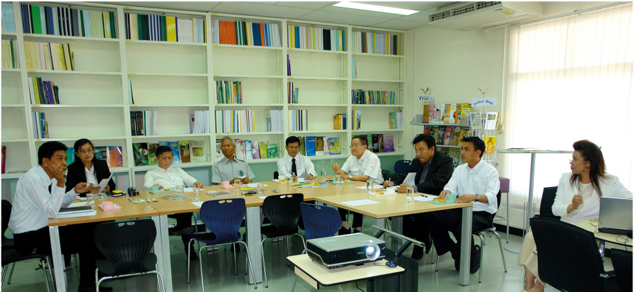
เวทีรับฟังความคิดเห็นจากผู้ทรงคุณวุฒิ