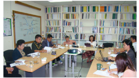
การประชุมคณะกรรมการประจำสภานับเมื่อ ม.ค. 55

ด้านสหกรณ์ จะให้การสนับสนุนแก่เครือข่ายเปา ปุ้นจิ้น ซึ่งเป็นเครือข่ายทรัพยากรมนุษย์ที่มี คุณค่า ในการขับเคลื่อนขบวนการสหกรณ์ตาม ภารกิจของตนเองต่อไป