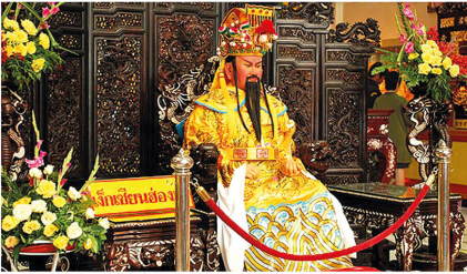
เจ๊กเซินฮองเต้