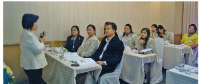
คณะทำงานยกร่างหลักสูตร