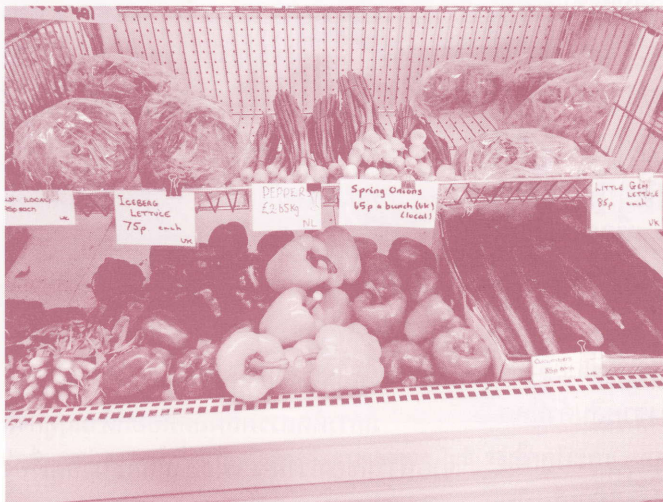
ผลผลิตสดจากฟาร์มสมิทส์ที่ร้านค้าสมิทส์

ต้องบังคับให้ซื้อเป็นแพ็ค ซึ่งมีปริมาณมากเกินไปความต้องการของลูกค้า การสร้างบรรยากาศในการ Shopping แก่ลูกค้า ด้วยการสรรห สินค้าแปลกใหม่ที่น่าสนใจ มาให้บริการ คุณค่าที่จะสร้างความประทับใจให้ลูกค้ากลับมาอุดหนุนสินค้า