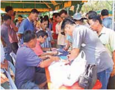
การประกันรายได้ขั้นต่ำของเกษตรกร

โครงการรับจำนำค่อยๆ จางลงและกำลังจะแห้งเหือดหายไป อีกทั้งประโยชน์อื่นๆ ที่โรงสีเคยได้รับการเข้าร่วมมาตรการของรัฐก็ไม่สามารถหาได้อีก เพราะรัฐจ่ายส่วนต่างของราคาข้าวเปลือกเป้าหมายกับราคาตลาดให้กับเกษตรกรโดยตรง