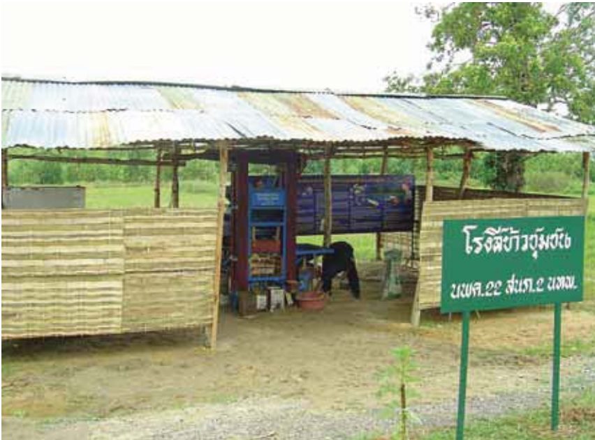
โรงสีขนาดเล็กในชุมชน

ในอดีตประเทศไทยมีโรงสีขนาดเล็กจำนวนมาก โรงสีขนาดเล็กๆ เหล่านี้มีกำลังการผลิตประมาณ 5-10 ตันต่อวัน มีที่ตั้งอยู่ในหมู่บ้านซึ่งจะรับจ้างสีข้าวเปลือกที่ชาวบ้านเก็บไว้ในยุ้งฉาง เมื่อต้องการจะใช้บริโภคในครัวเรือนก็จะค่อยๆ ทอยย่นำข้าวเปลือกออกมาสี ทั้งนี้โรงสีประเภทนี้จะเรียกเก็บค่าบริการสีกับชาวบ้านและในขณะเดียวกันก็จะได้รับและปลายข้าวซึ่งเป็นส่วนผลพลอยได้จากการรับจ้างสีแล้วนำไปจำหน่ายให้กับผู้เลี้ยงสัตว์อีกทอดหนึ่ง อย่างไรก็ตาม การคมนาคมที่มีความสะดวกมากขึ้นระหว่างหมู่บ้านกับ