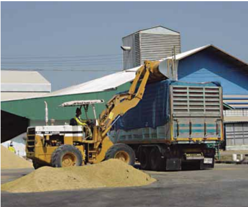
โรงสีขนาดใหญ่

อยู่ตามแหล่งที่เป็นทางผ่านที่มีความสะดวกในการขนส่ง ส่วนโรงสีขนาดใหญ่ก็มีกำลังการผลิตต่อวันมากกว่า 60 ตันขึ้นไป โรงสีขนาดใหญ่จะตั้งอยู่ในแหล่งผลิตข้าวที่สำคัญและมีความสะดวกในการคมนาคมขนส่ง