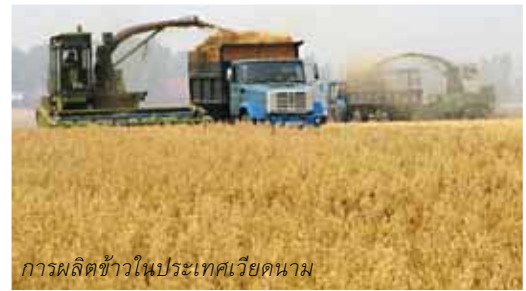
การผลิตข้าวในประเทศไทย

ทำให้ธุรกิจโรงสีได้ก้าวไปสู่ภาวะวิกฤตอันสืบเนื่องจากการแข่งขันกันในการลงทุนขยายขนาดกำลังการผลิตในอดีตที่ผ่านมา โดยไม่ได้ตระหนักถึงการเปลี่ยนแปลงในนโยบายและการเปลี่ยนแปลงของสภาพการตลาดข้าวในต่างประเทศ