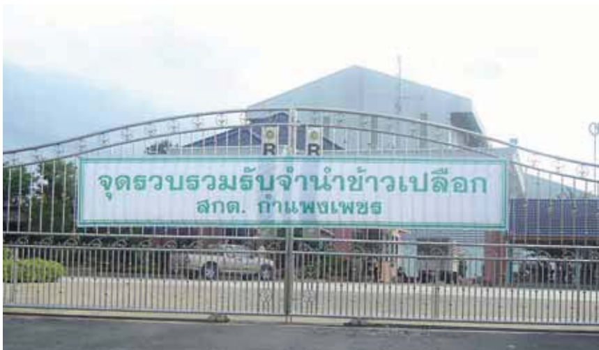
โครงการรับจำนำข้าวเปลือก โครงการรับจำนำข้าวเปลือก

ที่น่าตกใจหากเทียบสถานการณ์ ระหว่างกำลังการผลิตของโรงสีกับ ปริมาณผลผลิตข้าวในรอบปี จากเดิม ที่เคยอยู่ในสัดส่วนหนึ่งต่อหนึ่งในปี 2543 ได้เพิ่มมาเป็นสองต่อหนึ่งใน ปี 2551 ข้อมูลดังกล่าวบ่งชี้ว่าหาก โรงสีทุกโรงเปิดสีข้าวพร้อมกันจะมีข้าว เปลือกให้สีหมดภายในครึ่งปีเท่านั้น