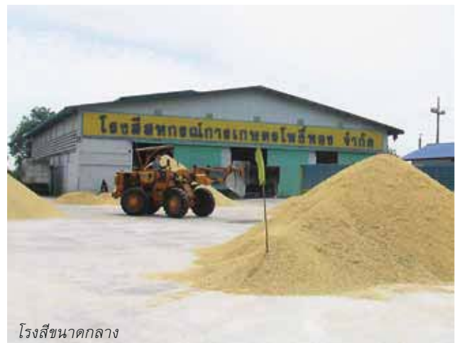
โรงสีขนาดกลาง