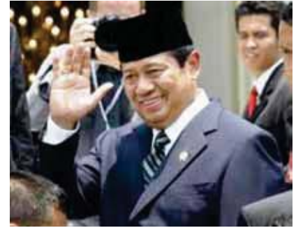
นายชูชีโล บัมบัง ยูโตโยโน ประธานาธิบดีอินโดนีเซีย

หัวข้อหลักของการประชุมในปีนี้เป็นคือ “Shared Norms for the New Reality” ที่สะท้อนถึงข้อเท็จจริงที่ว่าโลกของเรามีความซับซ้อนและความเชื่อมโยงต่างๆมากขึ้น หากในขณะเดียวกัน กลับเกิดการเสื่อมถอยของคุณค่าและหลักการที่ประชาคมโลกยึดถือร่วมกัน