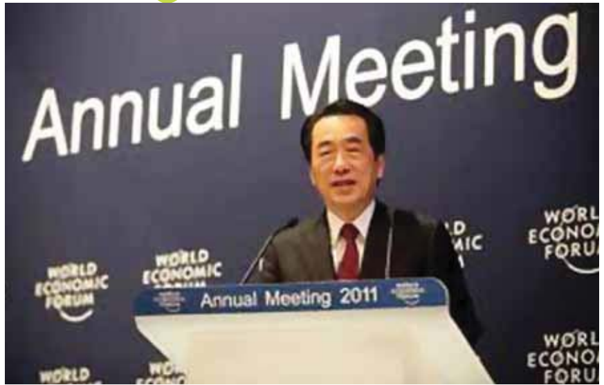
นายนาโตะ คัง นายกรัฐมนตรีประเทศญี่ปุ่น

นายนาโตะ คัง นายกรัฐมนตรีญี่ปุ่น กล่าวแก่ที่ประชุมเศรษฐกิจโลกประจำปี 2011 ณ เมืองดาวอสว่า การติดต่อและการก้าวไปสู่ความสัมพันธ์