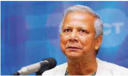
นายยูธัย ญูธาสร์ กรรมการผู้จัดการของธนาคารกรามีน

เพื่อสังคม นายยูธัย กล่าวถึงเส้นแบ่งระหว่าง “ธุรกิจที่เห็นแก่ตัว” ที่มุ่งแต่จะสร้างผลกำไร และ “ธุรกิจเพื่อสังคม” ซึ่งให้ความสำคัญต่อประโยชน์ด้านอื่นๆ เช่น การพัฒนา เป็นต้น ธุรกิจทั้งสองแบบดังกล่าวสามารถอยู่ร่วมกันได้ แต่การมีมาตรฐานและเป้าหมายร่วมกันจะเป็นการผลักดันให้เกิดภาพพจน์ใหม่ของมนุษยชาติ นายยูธัยมีชื่อเสียงเป็นอย่างมากในด้าน microcredit เขาได้รับรางวัลโนเบลสาขาสันติภาพพร้อมกับธนาคารกรามีนที่เขาก่อตั้งขึ้น นายยูธัย ญูธาสร์ ดำรงตำแหน่งในคณะกรรมการบริหารของ Schwab Foundation เพื่อกิจการสังคมอีกด้วย