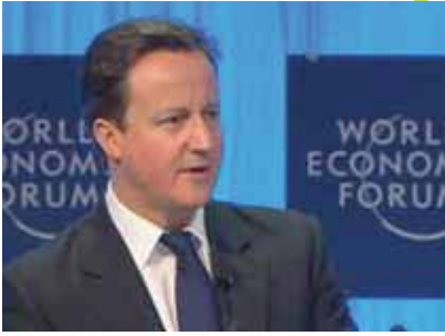
เดวิด คาเมรอน นายกรัฐมนตรีประเทศอังกฤษ

อยู่ให้ได้ด้วยตัวของเราเอง ประเทศอื่น ๆ ในโลกนี้ไม่ได้มีหน้าที่มาช่วยเหลือเราตลอดเวลา ดังนั้น เราต้องร่วมกันสร้างทางเลือกเพื่อทำในสิ่งที่แตกต่าง เราต้องสู้เพื่อความเจริญรุ่งเรืองของทวีปของเรา”