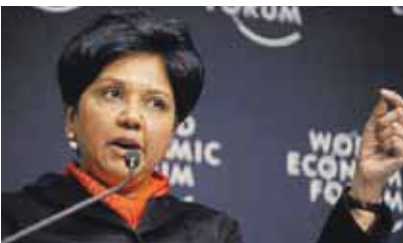
นางอินทรา ญูยี ประธานและผู้บริหารแห่ง PopsiCo

อินทรา ญูยี ประธานและผู้บริหารแห่ง PopsiCo กล่าวในที่ประชุมใหญ่ว่า นักธุรกิจทั้งหลายควรถูกส่งกลับไปเรียน