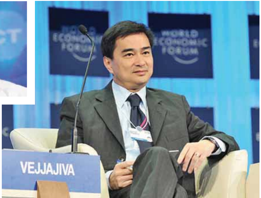
นายอภิสิทธิ์ เวชชาชีวะ นายกรัฐมนตรีแห่งประเทศไทย