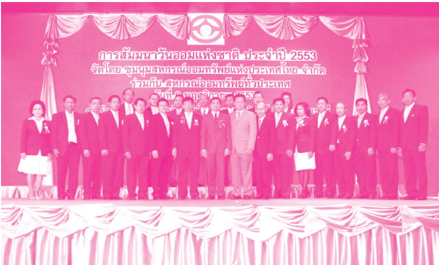
ที่ปรึกษา/ผู้ตรวจและผู้บริหาร ชสอ.ถ่ายภาพที่ระลึกร่วมกับท่านนายกรัฐมนตรี