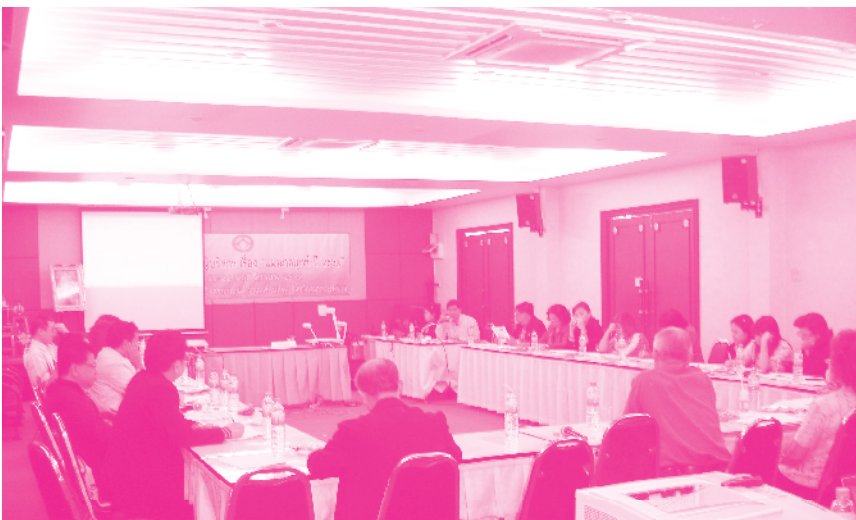
เวทีแลกเปลี่ยนเรียนรู้ระหว่างผู้นำ ชสอ.และผู้ทรงคุณวุฒิ