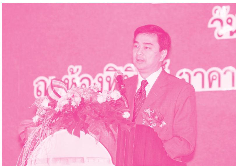
นายกรัฐมนตรี (อภิสิทธิ์ เวชชาชีวะ) เป็นประธานเปิดงาน

เมื่อวันที่ 6 พฤศจิกายน ที่ผ่านมา นายกรัฐมนตรี (อภิสิทธิ์ เวชชาชีวะ) ได้เป็นประธานในพิธีเปิดการสัมมนา “โครงการสัมมนาวันออมแห่งชาติ ประจำปี 2553” ณ ห้องประชุมพีบีทรี อาคาร เอ็กซีutiveเซ็นเตอร์ ศูนย์แสดงสินค้าและการประชุมอิมแพ็คเมืองทองธานี จังหวัดนนทบุรี โดยได้แสดงความขอบคุณ ชสอ. ที่ได้สนับสนุนนโยบายส่งเสริมการออมของรัฐบาล และแสดงความชื่นชมกับสหกรณ์ที่ประสบความสำเร็จในการกระตุ้นให้เกิดการออม และขอให้ขยายผล ขยายเครือข่าย ขยายความรู้ไปสู่สหกรณ์ และชุมชนอื่นต่อไป