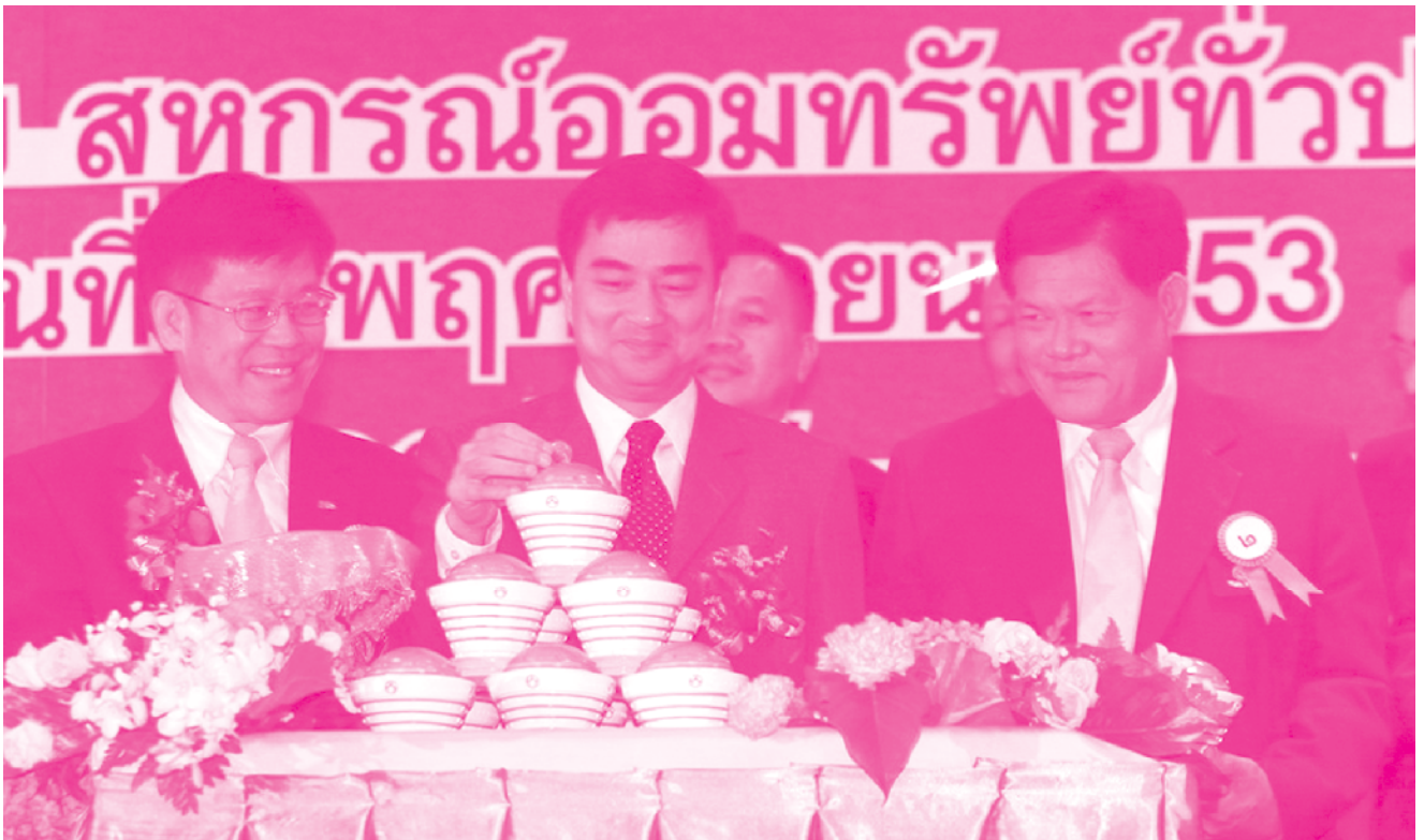
นายกรัฐมนตรี หยอดเหรียญในกระปุกออมสิน