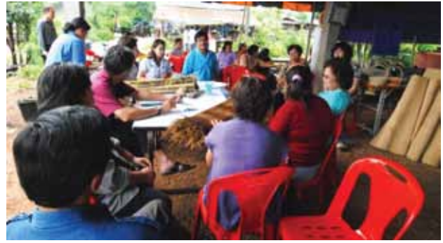
กลุ่ม/องค์กรภาคประชาชนที่เกิดเพิ่มขึ้นเรื่อยๆ

แนวคิดเรื่องสหกรณ์ในสังคมไทยไม่ชัดเจน ดังนั้นกลุ่มคนที่เข้ามามีส่วนร่วม และกลุ่มคนที่เป็นฝ่ายสนับสนุน จึงละเลยเรื่องคุณค่าสหกรณ์ ขาดกระบวนการทัศน์ และละเลยหลักการและ