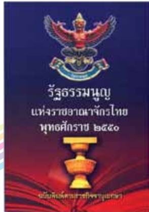
รัฐธรรมนูญ ฉบับ พ.ศ. 2550

• รัฐธรรมนูญ ฉบับ พ.ศ. 2550 มีทิศทางเชิงนโยบายในการสนับสนุนการจัดตั้งกลุ่ม / องค์กร ดังกล่าวมากขึ้น ตามที่กำหนดไว้ในมาตรา 84 เดิม “รัฐส่งเสริม สนับสนุน และคุ้มครองระบบสหกรณ์” เป็น “รัฐส่งเสริม สนับสนุน และคุ้มครองระบบสหกรณ์ให้เป็นอิสระ และการรวมกลุ่มการประกอบอาชีพหรือวิชาชีพตลอดทั้งการรวมกลุ่มของประชาชนเพื่อดำเนินกิจการด้านเศรษฐกิจ”