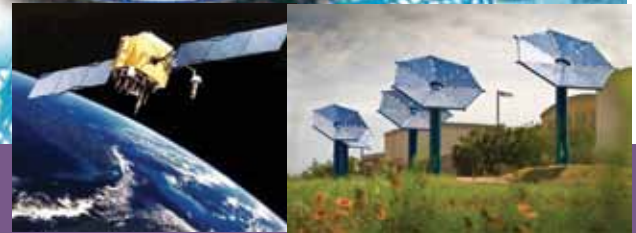
เทคโนโลยีและนวัตกรรมที่ก้าวล้ำยุค

สถานการณ์ด้านเศรษฐกิจสังคมของประเทศที่เผชิญหน้าอย่างท้าทายกับภาวะการแข่งขันภายใต้นโยบายเปิดการค้าเสรี ซึ่งคนในสังคมมีศักยภาพในการบริโภคข้อมูลข่าวสารได้อย่างรวดเร็ว ดังจะสังเกตได้จากกลยุทธ์การตลาดต่างๆ ที่ผู้ประกอบการได้นำมาใช้ในการดึงดูดความสนใจในกลุ่มเป้าหมายทางธุรกิจของตน ภายใต้กรอบคิดการดำเนินธุรกิจของภาคเอกชน ซึ่งมี “กำไร” เป็นแรงจูงใจในการทำธุรกิจนั้น หากเป็นตลาดที่กลุ่มผู้บริโภคมีอำนาจซื้อก็ไม่เกิดปัญหาและผลกระทบต่อมากนัก และยินดีที่จะจ่ายในราคาที่ตนมีความพึงพอใจ เพื่อให้ได้มาซึ่งสินค้าและบริการแก่ตน อย่างไรก็ตามสำหรับผู้บริโภคบางกลุ่มที่มีภาระการครองชีพในระดับกลางและระดับต่ำนั้น มีความจำเป็นต้องเลือก สำหรับสินค้าเพื่อการดำรงชีวิต และมีเหลือสำหรับจับจ่ายใช้สอย เพื่อการศึกษา สาธารณูปโภค และอื่นๆ ตามอัธยาศัย