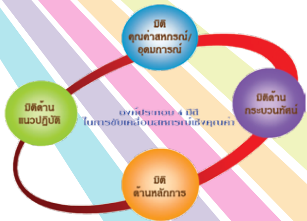
องค์ประกอบ 4 มิติในการขับเคลื่อนสหกรณ์เชิงคุณค่า

การบริหารจัดการสหกรณ์ส่วนใหญ่ ไม่ได้ให้ความสำคัญกับการบริหารจัดการทรัพยากรของสหกรณ์แบบองค์รวม ทั้งในเรื่องของการบริหารทรัพยากรของสหกรณ์เอง และความเชื่อมโยงระหว่างปัจจัยสภาพแวดล้อมภายนอกที่มีการเปลี่ยนแปลงกับบริบทการดำเนินงานของสหกรณ์ โครงสร้างการบริหารจัดการที่ถูกออกแบบให้ผู้บริหารสหกรณ์ผลัดเปลี่ยนหมุนเวียนเข้ามาบริหารจัดการสหกรณ์ไม่เอื้อต่อการบริหารจัดการแบบมืออาชีพ จึงจะเห็นปรากฏการณ์โดยทั่วไปที่ผู้บริหารสหกรณ์ มักใช้ดุลพินิจซึ่งเป็นความชำนาญเฉพาะตัว และเฉพาะกลุ่มมาตัดสินใจเชิงนโยบายสหกรณ์ กอปรกับการขาดข้อมูลเชิงประจักษ์และฐานข้อมูลที่จำเป็นสำหรับการดำเนินงานของสหกรณ์ ดังนั้นการบริหารจัดการสหกรณ์ จึงมักเป็นไปแบบแยกส่วน ทั้งในระดับสหกรณ์ขั้นปฐมและขบวนการสหกรณ์ ซึ่งส่งผลกระทบต่อประสิทธิภาพและประสิทธิผล และประโยชน์ที่พึงมีต่อสมาชิกและขบวนการสหกรณ์ตามกรอบคิดและแนวทางของสหกรณ์ที่ควรจะเป็น