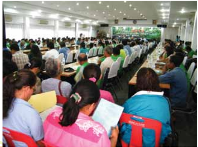
การให้การศึกษาอบรมในรูปแบบเดิม

สหกรณ์ส่วนใหญ่มุ่งไปที่พันธะความรับผิดชอบต่อที่มีต่อหน่วยงานรัฐ ซึ่งเป็นไปตามเงื่อนไขที่กำหนดไว้ในกฎหมาย