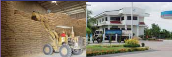
สหกรณ์การเกษตร

ข้อค้นพบจากการวิจัยภายใต้ชุดโครงการการขับเคลื่อนการพัฒนาการสหกรณ์และการค้าที่เป็นธรรม ภายใต้การสนับสนุนของสำนักงานกองทุนสนับสนุนการวิจัย ซึ่งเริ่มดำเนินการมาตั้งแต่ปี 2543 จนถึงปัจจุบัน เป็นเวลา 10 ปี บนเส้นทาง การวิจัยเชิงปฏิบัติการแบบมีส่วนร่วม ร่วมกับภาคีจตุรมิติ ทั้งภาคขบวนการ ภาครัฐ ภาควิชาการ และภาคประชาชนนั้น ได้ชี้ให้เห็นข้อจำกัดของการพัฒนาสหกรณ์ในทิศทางของการนำคุณค่าและการค้าที่เป็นธรรม 6 ประการ ได้แก่