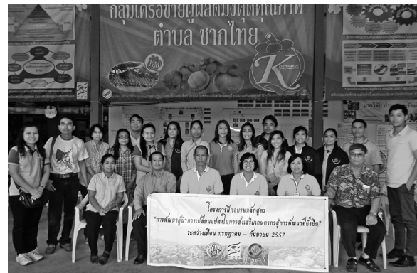
คณะดูงานถ่ายภาพหมู่เป็นที่ระลึกร่วมกัน

กลุ่ม ได้เล่าว่า ตนภูมิใจและรักในอาชีพเกษตรกร เชื่อว่าการส่งเสริมเกษตรกรให้เกิดการพัฒนาได้นั้นต้องมองหรือเปลี่ยนทัศนคติ