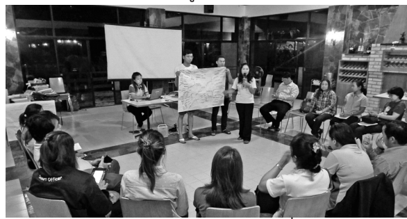
ทีม Smart Officers ร่วมถอดบทเรียนความรู้ที่ได้รับจากการดำเนินงานเพื่อไปปรับใช้กับการทำงานจริง