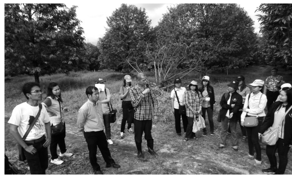
Smart Officers ร่วมเรียนรู้กับพ่อวิชัยในห้องเรียนธรรมชาติ