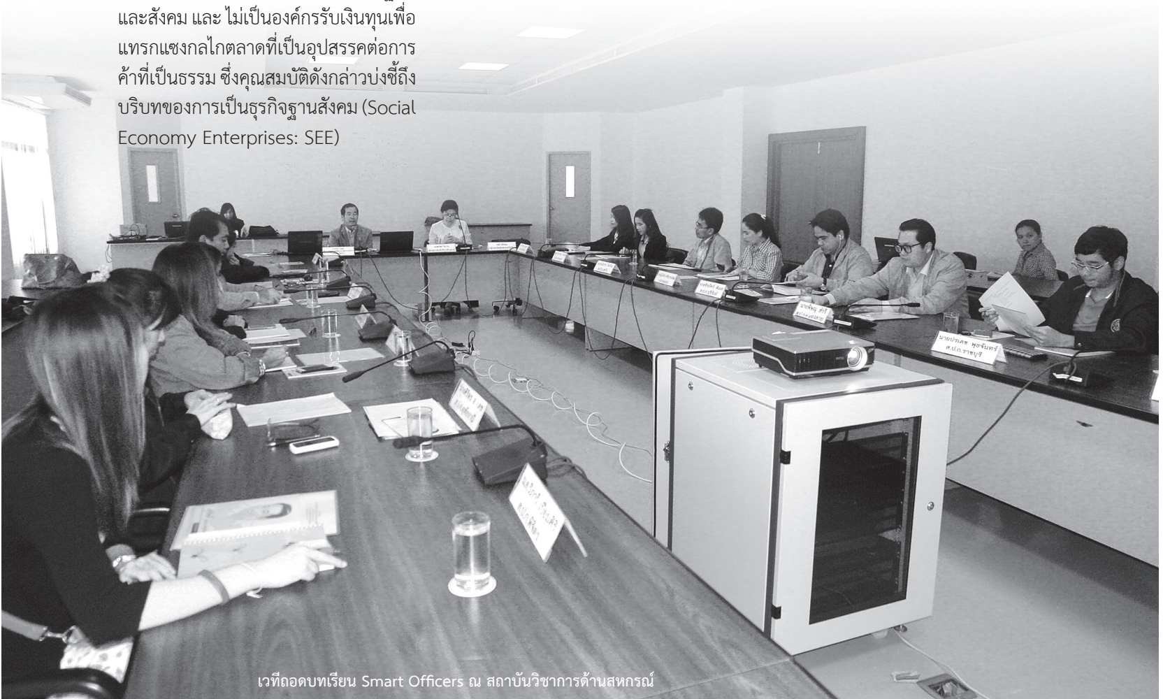
เวทีถอดบทเรียน Smart Officers ณ สถาบันวิชาการด้านสหกรณ์

ภารกิจในการจัดที่ดินและที่อยู่อาศัยให้เกษตรกร คุ้มครองที่ดินเพื่อเกษตรกรรม พันธุ์สภาพแวดล้อม รวมทั้งการพัฒนาความรู้และขีดความสามารถเกษตรกร นับว่าเป็นบทบาทหน้าที่ที่สำคัญของสำนักงานการปฏิรูปที่ดินเพื่อเกษตรกรรม (ส.ป.ก.) ซึ่งปัจจุบัน ส.ป.ก. จัดที่ดินให้กับเกษตรกรไปแล้วกว่า 2.7 ล้านราย เนื้อที่กว่า 37 ล้านไร่ เกษตรกรที่ได้รับการจัดสรรที่ดินทำกินส่วนใหญ่ยังใช้ประโยชน์ที่ดินอย่างไม่เต็มประสิทธิภาพ ขาดความมั่นใจในอาชีพเกษตร ทั้งนี้ส่วนหนึ่งเป็นผลมาจากการที่ผู้ที่ได้รับจัดสรรที่ดินทำกินส่วนใหญ่ยังขาดการจัดการอย่างเป็นระบบและไม่รู้เท่าทันต่อการเปลี่ยนแปลง ทำให้ไม่สามารถปรับตัวอย่างทันเหตุการณ์