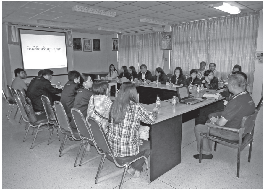
ทีม Smart Officers ศึกษาทำงานสหกรณ์การเกษตรเขาคิชฌกูฏ จำกัด

ส.ป.ก. จึงร่วมกับ สถาบันวิชาการด้านสหกรณ์ มหาวิทยาลัยเกษตรศาสตร์ พัฒนาระบบส่งเสริมเรียนรู้ยกระดับสมรรถนะการแข่งขัน โดยการใช้กลไกธุรกิจฐานสังคมในการลดช่องว่างเชิงนโยบายและการปฏิบัติสู่การบรรลุเป้าหมายการพัฒนาอาชีพเกษตรกรในเขตปฏิรูปที่ดินแก่เจ้าหน้าที่ ส.ป.ก. เพื่อสร้างผู้นำการเปลี่ยนแปลงในการส่งเสริมเกษตรกรสู่การพัฒนาที่ยั่งยืน สามารถยกระดับขีดความสามารถของเกษตรกรในการประกอบอาชีพที่ก่อให้เกิดสมดุลในการ