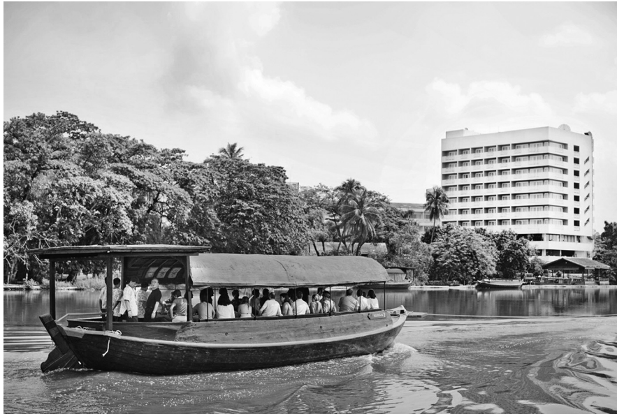
โรงแรมสามพรานริเวอร์ไซด์ จ.นครปฐม

บนการพึ่งพาตนเอง ตลอดจนการสร้างคุณค่าและมูลค่าเพิ่มแก่สินค้าที่ผลิตในชุมชน