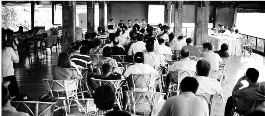
การสร้างความเข้าใจและร่วมขับเคลื่อนกลุ่มธุรกิจเชิงคุณค่าสามพรานร่วมกัน