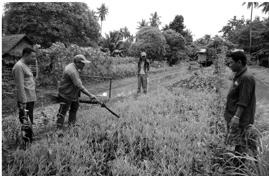
การตรวจแปลงเกษตรอินทรีย์

เวทีแลกเปลี่ยนเรียนรู้ โดยมีนักวิชาการจากมหาวิทยาลัยเกษตรศาสตร์เป็นผู้ให้คำแนะนำ ซึ่งในที่สุดได้ข้อตกลงร่วมกันในการจัดตั้งและดำเนินงาน “กลุ่มธุรกิจเชิงคุณค่าสามพราน” โดยภาคีที่เข้ามามีส่วนร่วม ประกอบด้วยกลุ่มเกษตรกร โรงเรียน ผู้นำเกษตรกร ได้เห็นชอบในการกำหนดปณิธานร่วม “ภาคีทุกคนต้องเข้าใจ และเข้าถึงเกษตรอินทรีย์ โดยมีสวนสามพรานเป็นเสาหลัก ในการให้ความรู้และปัญญาไปสู่ความกินดีอยู่ดีมีสุขถ้วนหน้า”