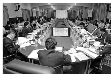
กิจกรรมที่ดำเนินการภายใต้การวิจัยเชิงปฏิบัติการแบบมีส่วนร่วม