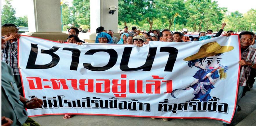
ปัญหาที่ชาวนาเผชิญกับโครงการรับจำนำของรัฐ