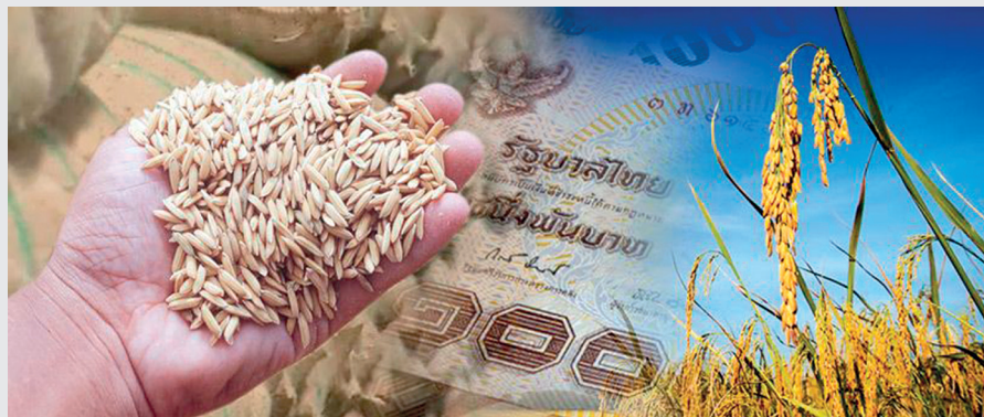
รายได้จากการขายข้าวไม่เพียงพอต่อค่าใช้จ่ายในการทำนา

คำตอบ คือ ชาวนาที่อยู่ได้ส่วนใหญ่จะเป็นชาวนาที่มีที่ดินเป็นของตนเอง บางคนมีทุนของตนเอง และสามารถเช่าที่ดินมาทำนามากขึ้น ก็มีโอกาสดำเนินชีวิตตามเจตนารมณ์ของรัฐบาลมากหน่อย แต่สำหรับชาวนารายย่อย ซึ่งไม่มีทางเลือกในการเข้าถึงแหล่งทุนและแหล่งปัจจัยการผลิตในราคาปกติ ที่ต้องหันไปพึ่งพานายทุนนอกระบบด้วยความจำยอม จึงเป็นเหตุปัจจัยสำคัญของภาระหนี้สินของ