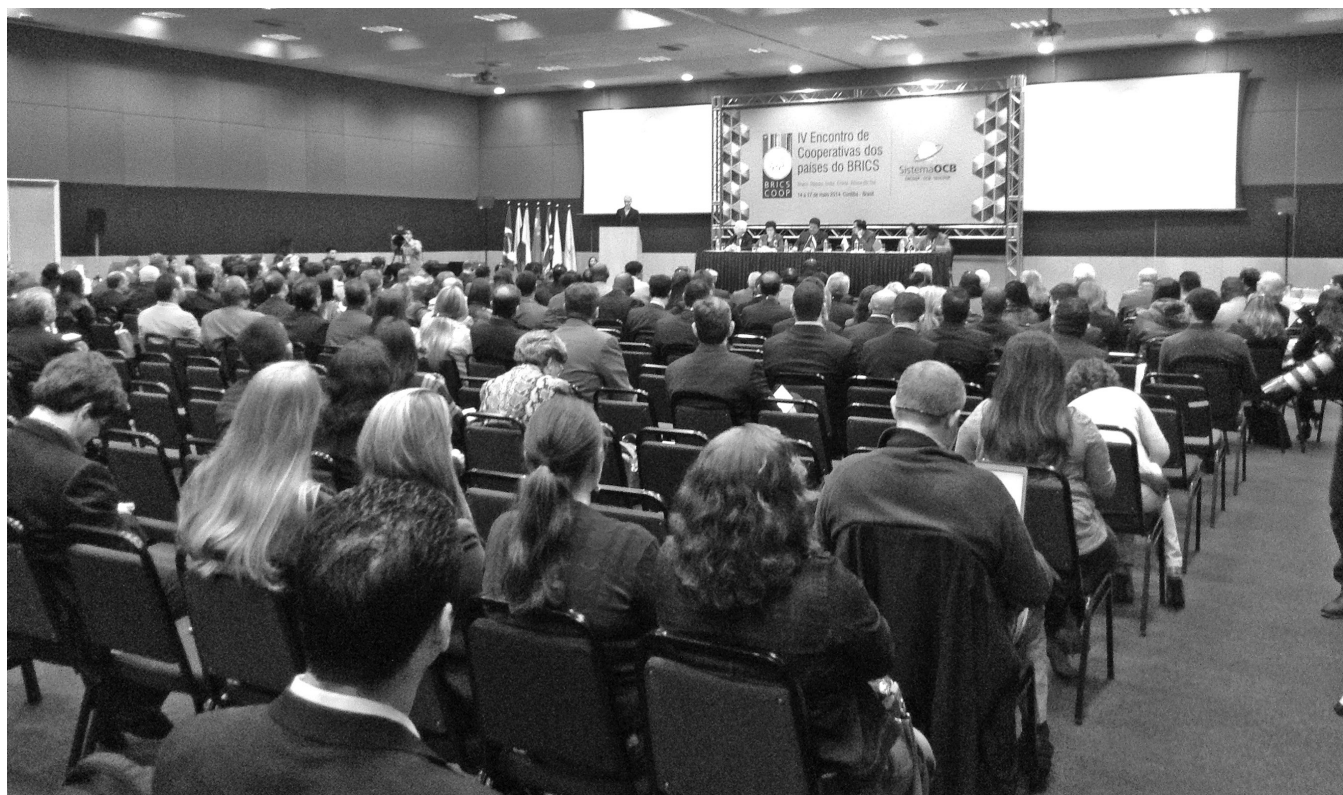
การประชุมกลุ่มประเทศ BRICS ครั้งที่ 4 ณ เมืองควิริติบา ประเทศบราซิล