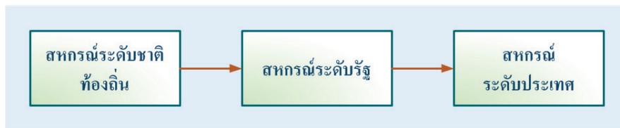
รูปแบบของการค้าระหว่างสหกรณ์ต่างระดับ

พจนานุกรมออนไลน์ด้านการค้าจะช่วยยกระดับการพัฒนาทั้งในระดับประเทศและระดับภูมิภาค ซึ่งจะนำไปสู่การจัดตั้งองค์กรกลางในระดับโลกในอนาคต การค้าดังกล่าวสามารถขยายไปในการทำธุรกิจระหว่างธุรกิจกับธุรกิจ ซึ่งจะช่วยในด้านการจัดหาปัจจัยการผลิต ระหว่างสหกรณ์ต่างประเภท กรอบแนวทางดังกล่าวจะสามารถ