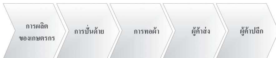
โซ่คุณค่าของผลิตภัณฑ์สิ่งทอ