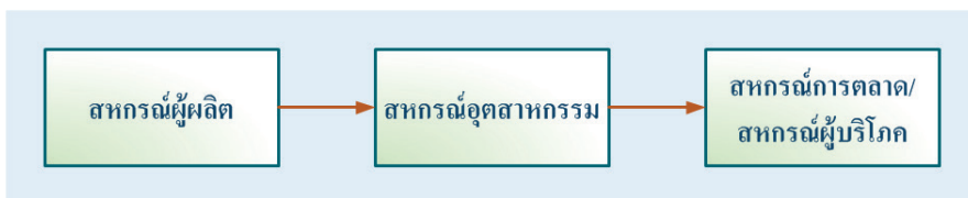
C2C Trade ระหว่างสหกรณ์ต่างประเภท

ตัวแบบการค้าสามารถจำแนกออกเป็นธุรกิจกับธุรกิจ(B2B) และธุรกิจกับสหกรณ์ (B2C) ตัวแบบธุรกิจ 2 แขนงนี้ ในรูปแบบของการค้าระหว่างสหกรณ์ต่างระดับได้แก่ ชุมชุมสหกรณ์ระดับชาติ ซึ่ง