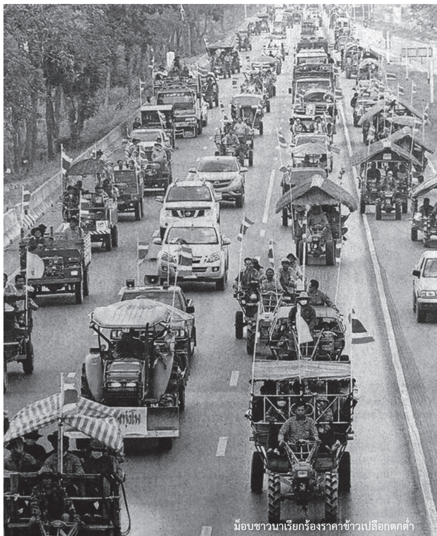
มือชาวนาเรียกร้องราคาข้าวเปลือกตกต่ำ

หรืออีกแนวทางหนึ่งเกษตรกรจะต้องผลิตสินค้าที่มีคุณภาพเป็นสินค้าที่มีความแตกต่างจากผู้อื่นในสายตาผู้บริโภคเป็นที่ต้องการของตลาด เช่น ผลิตสินค้าที่ปลอดภัยจากสารพิษ หรือ ผลิตสินค้าเกษตรอินทรีย์ต่างๆ ที่ได้มาตรฐานเป็นที่ยอมรับของผู้บริโภคก็จะสามารถขายได้ในราคาที่สูงกว่าสินค้าปกติทั่วไปโดยรัฐบาลต้องมีนโยบายสนับสนุนที่ชัดเจนทั้งด้านการผลิตและด้านตลาด