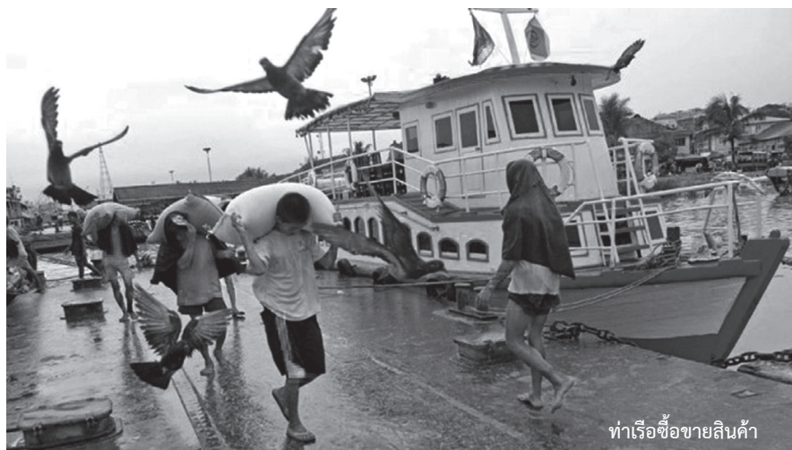
ทำเรือซื้อขายสินค้า

สำหรับในกรณีการเกิดของ ราคาที่เกิดจากการแทรกแซงของรัฐบาล ซึ่งส่วนใหญ่เป็นนโยบายของรัฐบาลที่ ต้องการทำให้ราคาตลาดที่ผู้ผลิตขาย ได้สูงกว่าราคาตลาด รัฐบาลก็จะเข้าไป แทรกแซงกลไกตลาดโดยกำหนดราคา รับซื้อเพื่อให้เกษตรกรขายได้ในราคาที่ สูงกว่าราคาตลาด โดยมีวิธีต่างๆเช่นการ ประกันราคาขั้นต่ำ การประกันรายได้ขั้น ต่ำและการรับจำ เป็นต้นซึ่งในปัจจุบัน รัฐบาลนิยมใช้นโยบายรับจำนำกับสินค้า เกษตรประเภทโดยรับจำนำในราคาที่สูง กว่าราคาตลาด เช่น ในกรณีของการรับ จำนำข้าวเปลือก ซึ่งรัฐบาลดำเนินการ โดยรับจำนำข้าวเปลือกผ่านโรงสีที่เข้า ร่วมโครงการแล้วสั่งให้โรงสีแปรสภาพ เป็นข้าวสารตามระยะเวลาที่กำหนด แล้ว