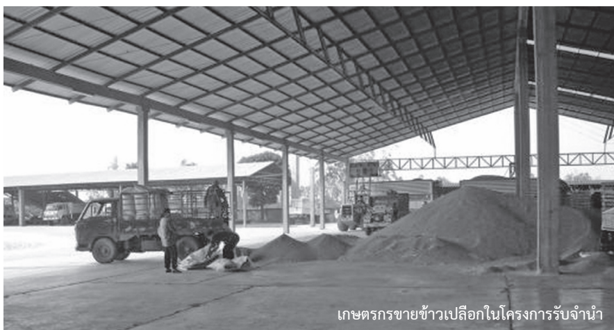
เกษตรกรขายข้าวเปลือกในโครงการรับจำนำ