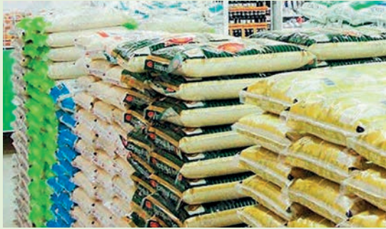
ข้าวหอมมะลิบรรจุถุง

ผู้ประกอบการข้าวเปลือกในตลาดเอกชนในที่นี่จะมีผู้ประกอบการที่เป็นสหกรณ์การเกษตร ผู้ประกอบการโรงสี ตลอดจนผู้รวบรวมในท้องถิ่นซึ่งจะมีตัวแทนเข้าไปรับซื้อผลผลิตจากเกษตรกร อีกทั้งการดูแลรักษาคุณภาพข้าวเปลือกก็จะทำได้ดีกว่าข้าวในโครงการรับจำนำของรัฐ ข้าวเปลือกที่รวบรวมได้จะถูกนำส่งไปยังโรงสีทั้งโรงสีสหกรณ์การเกษตรหรือโรงสีข้าวของเอกชน เมื่อมีการแปรรูปเป็นข้าวสารแล้วก็จะเข้าสู่กระบวนการบรรจุถุง ในที่นี้ผู้ประกอบการข้าวหอมมะลิบรรจุถุงจะประกอบด้วยโรงสีของสหกรณ์การเกษตรและโรงสีเอกชนบางแห่ง การทำข้าวสารบรรจุถุงของสหกรณ์การเกษตรมักจะจัดทำในรูปแบบของผลิตภัณฑ์สินค้าโอท็อป วางจำหน่าย