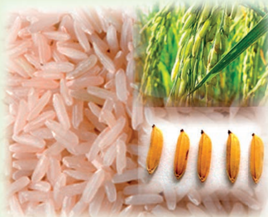
คุณสมบัติจำเพาะของข้าวหอมมะลิที่ผู้บริโภคควรรู้

ตามแหล่งผลิตของอำเภอหรือของจังหวัดสำหรับข้าวสารหอมมะลิลีกส่วนหนึ่งที่โรงสีแปรรูปแล้ว จะถูกส่งต่อไปยังผู้ประกอบการข้าวถุงเพื่อการทำความสะดวกอีกครั้งหนึ่งก่อนที่จะทำการบรรจุให้กับผู้ประกอบการร้านค้า ดังนั้นจะเห็นว่าที่มาของวัตถุดิบข้าวหอมมะลิบรรจุถุงจะมีที่มาจากตลาดข้าวเปลือกของเอกชนมากกว่าจะมาจากตลาดข้าวเปลือกภายใต้โครงการรับจำนำของรัฐ