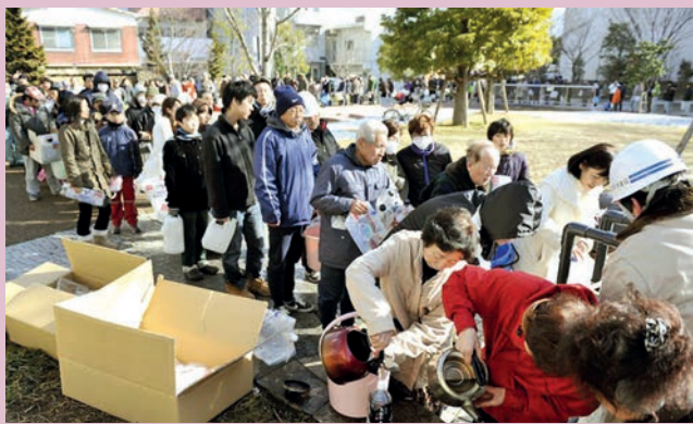
คนญี่ปุ่นเข้าแถวรอรับ บริจาคของเมื่อครั้งสึนามิ ถล่มในปี 2554