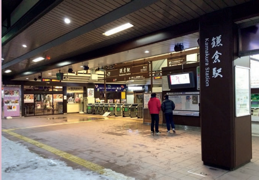
สถานีรถไฟคามาคุระ

ประเด็นที่ผู้เขียนได้พบหลังจาก ประสพภัยในครั้งนี ้หาได้เกี่ยวข้องกับ สหกรณ์โดยตรง แต่ผู้เขียน มองในด้าน ตรงกันข้ามว่า การพัฒนาสหกรณ์ใน ประเทศไทยที่เรา กำลังพยายามพัฒนา กันอย่างแข็งขันนั้น เราได้มองข้ามสิ่ง สำคัญสิ่งหนึ่งกันไปหรือไม่? สิ่ง ที่ผู้เขียน กำลังพูดถึงนั้นก็คือ “คน”