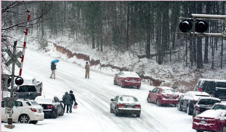
พายุหิมะถล่มญี่ปุ่น การจราจรใช้การไม่ได้