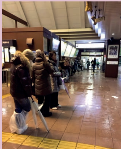
ผู้โดยสารติดอยู่ที่สถานีรถไฟ

ผู้เขียนก็เป็นหนึ่งในผู้ประสพภัยพายุ หิมะในครั้งนี ้ด้วย ผู้เขียนเลยมีโอกา สได้ พบกับประสบการณ์มากมาย ณ สถานี รถไฟเล็กๆแห่งนี้ เช่น การทางรถไฟที่