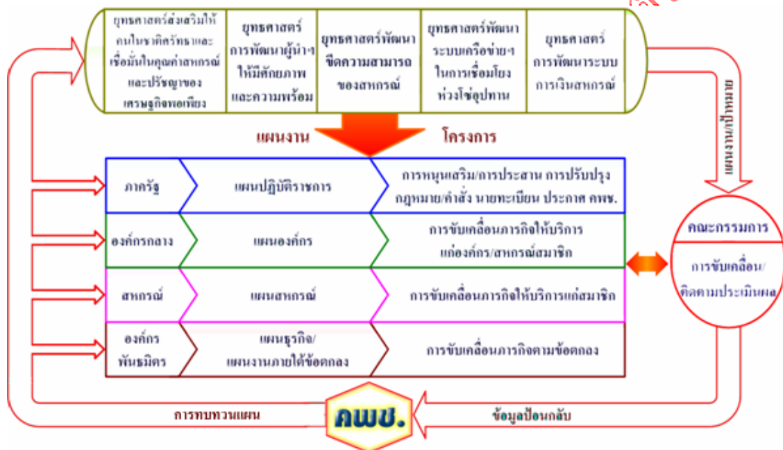
รูปที่ 4 กลไกการขับเคลื่อนแผนพัฒนาการสหกรณ์ ฉบับที่ 2 สู่การปฏิบัติ

โดยคพช. เพื่อให้มีกรอบภารกิจในการเสริมสร้างบทบาทการมีส่วนร่วมของทุกภาคส่วนที่เกี่ยวข้องให้เกิดบูรณาการในการขับเคลื่อนยุทธศาสตร์การพัฒนา เพื่อการบรรลุเป้าหมายร่วมกัน ซึ่งจะต้องมีแผนปฏิบัติการในระดับต่าง ๆ เช่น ในส่วนของภาครัฐก็ให้มีแผนปฏิบัติราชการ องค์กรกลางจัดทำแผนองค์กร สหกรณ์จัดทำแผนสหกรณ์ องค์กรพันธมิตรที่เกี่ยวข้องจัดทำแผนธุรกิจและแผนความร่วมมือ นอกจากนี้จะต้องมีการพัฒนาระบบติดตามประเมินผลสำหรับตัวชี้วัดความสำเร็จอย่างเป็นกระบวนการ ทั้งในระดับภาพรวมระดับยุทธศาสตร์ และระดับองค์กร(หน่วยงาน) โดยคณะผู้วิจัยและยกวางได้เน้นที่ความสำคัญ ในขั้นตอนแรก หลังจากคณะรัฐมนตรีให้ความเห็นชอบแล้วสิ่งที่ควรดำเนินการเป็นอันดับแรกก่อนอื่นคือ การจัดเวทีสร้างความเข้าใจในเรื่องกรอบทิศทางพัฒนาของแผนฯแก่ผู้นำและผู้มีส่วนเกี่ยวข้อง เพื่อให้ได้เข้าใจและตระหนักเห็นความสำคัญ เพื่อจะได้เข้ามามีส่วนร่วมในการขับเคลื่อนยุทธศาสตร์ได้อย่างถูกต้องเหมาะสม